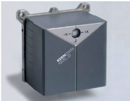
Abb. 1: Die Weiterentwicklung als Zweineigungssensor Kern Nivel 20 fand gar Aufnahme im Museum für Gestaltung, dem Archiv der Zürcher Hochschule der Künste.

Eine Erfindung, die so verschiedene Disziplinen wie Mechanik, Optik, Physik, Chemie und Vermessung vereint, die in der Zeit der analogen Messtechnik gemacht wurde und noch heute in der digitalen Mess- und Sensortechnik erfolgreich eingesetzt wird, verdient gewürdigt zu werden. Diese Erfolgsgeschichte, die 1960 begann, schreibt ein Kompensator, wie er in Nivellieren und Theodoliten eingesetzt wird, um Restneigungen auszugleichen: beim Nivellier die Zielachse, beim Theodolit die Stehachse. Als automatische Höhenkollimation für den neuen Sekundentheodolit DKM2-A suchten die Ingenieure bei der Firma Kern & Co. AG in Aarau eine Verbesserung der damals üblichen Pendelkompensatoren. Sie erfanden einen neuartigen Flüssigkeitskompensator mit hoher Genauigkeit, optimaler Dämpfung und ohne mechanische Teile: bestehend einfach, zeitlos und wartungsfrei – eine geniale Lösung. Auf der Webseite der Studiensammlung Kern