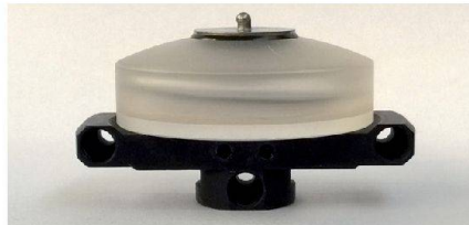
Abb. 3: Die Kompensator-Dose aus Glas mit einem Teil der Abbildungsoptik (unten) und dem Einfüllstutzen für die Flüssigkeit (oben).

des Stadtmuseums Aarau wird diese Geschichte auf eine besondere Art erzählt. Anhand einer Vielzahl von Dokumenten, Artikeln, Bildern, Plakaten, Prospekten, Inseraten und Patentschriften erfährt man viel Wissenswertes über Entwicklung, Einsatz und Funktion dieser genialen Dose.