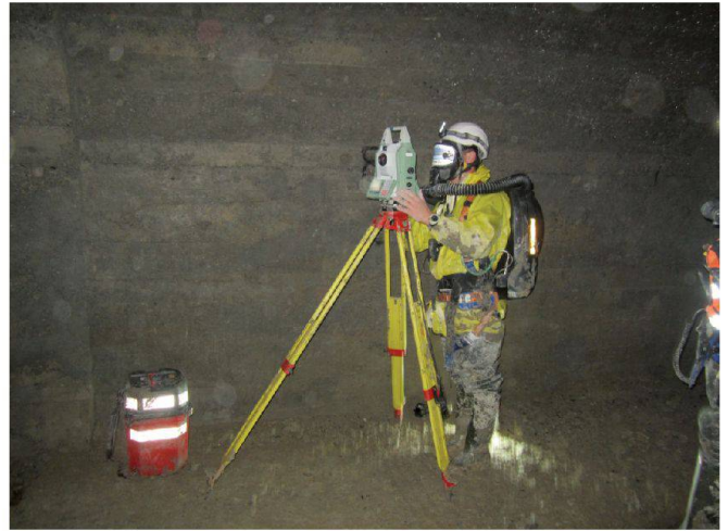
Abb. 2: Tachymetermessung mit Atemschutzgerät.