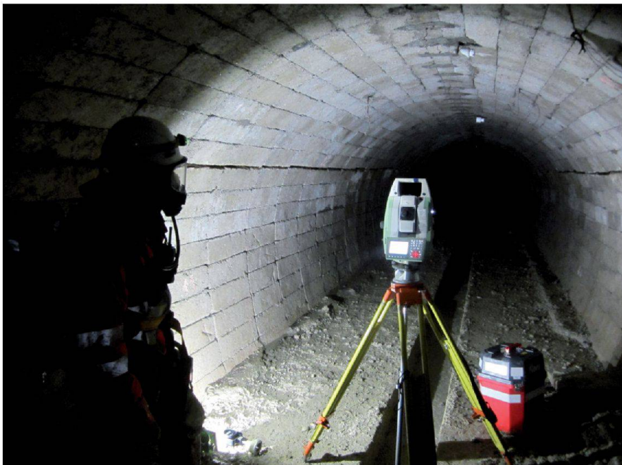
Abb. 8: Leica Multistation MS50.

Polygonzug im Stollen und den Kreiselmessungen in der Ausgleichsoftware LTOP. Gelagert wurde das Netz auf den Fixpunkten der amtlichen Vermessung. Am Stollenende konnte eine Messgenauigkeit (1 Sigma) von 4 cm in der Lage und eine Höhengenaugigkeit von 2 cm erreicht werden, womit die Anforderungen des Auftraggebers erreicht wurden.