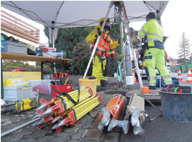
Abb. 3: Rettungshubeinrichtung.