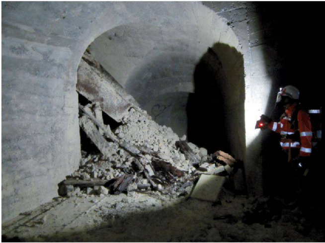
Abb. 1: Stolleneinbruch.