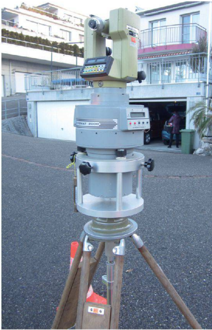
Abb. 5: Kreisel Gyrometer 2000.

Für den sicheren Auf- und Abstieg und den Materialtransport in den Stollen durch den Vertikalschacht musste eine Rettungshubeinrichtung (Dreibein) aufgestellt werden (siehe Abb. 3). Diese wurde durch einen Spezialisten der ISS Kanal Services AG bereitgestellt und bedient. Damit das viele Atemschutz- und Messmaterial im Stollen trocken zwischengelagert werden konnte, musste im Bereich des Vertikalschachts ein Wasserschutz (Schwimmelemente) aufgebaut werden (siehe Abb. 4). Diese dienten auch als Rettungsbarren in einem Notfall. In einem Sicherheitskonzept wurde das Vorgehen je-