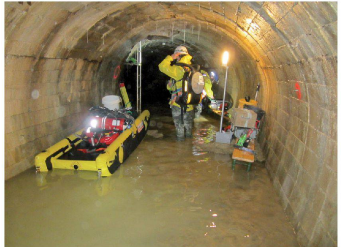
Abb. 4: Wasserschutz für Materialdepot.

positives bedeutete. Weiter besitzt der Stollen drei zusätzliche kavernenartige Ausbrüche, welche teilweise verschüttet sind. Diese dienten ursprünglich als Verladestationen und Wendepunkte für die Materialtransportbahn. Die beiden Stollenenden sind nicht ausgebaut und befinden sich somit noch im Rohausbruch. Diese Extrembedingungen machten die Vermessungsarbeiten zu einer echten logistischen und sicherheitstechnischen Herausforderung.