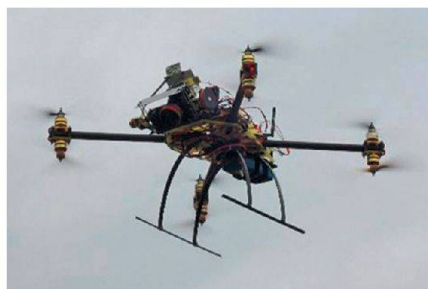
Abb. 1: Oktokopter mit Ausrüstung (Durchmesser: 80 cm).

Das individuelle Design eines senkrecht startenden MAV ermöglicht eine Befestigung aller erforderlichen Geräte, um moderne Photogrammetrie durchzuführen. Die Plattform wurde mit acht bürstenlosen Motoren ausgerüstet, um die Nutzlast und die Redundanz im Falle eines Motorschadens zu erhöhen. Auf dem MAV sind verschiedenste Sensoren untergebracht. Unter anderem befindet sich auf der Plattform der von der gleichnamigen Gemeinschaft entwickelte Autopilot ArduPilot APM 2.6 , welcher für die Stabilisierung zuständig ist und den autonomen Flug sicherstellt. Er besteht aus MEMS Gyroskopen und Beschleunigungssensoren, einem dreiachsigen Magnetsensor, einem barometrischen Drucksensor und einem kostengünstigen Einfrequenz-GPS-Empfänger. Das Zusammenwirken all dieser Navigationskomponenten erlaubt eine