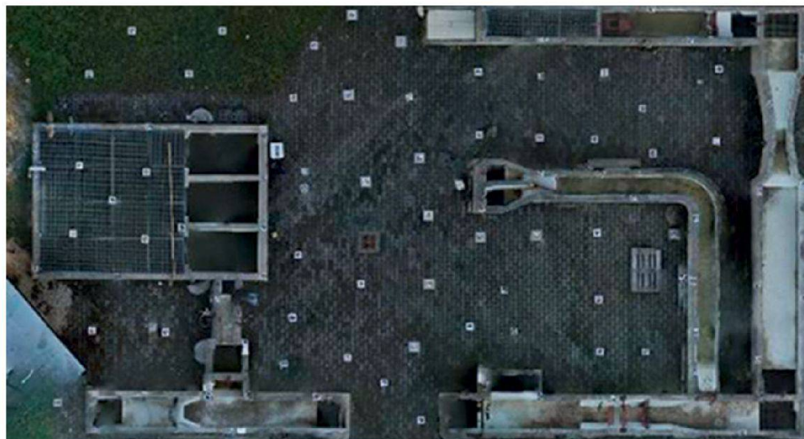
Abb. 3: Kalibrierungsfeld an der EPFL.

Es wurden zwei Flüge durchgeführt: an verschiedenen Tagen und mit unterschiedlichen Umgebungsbedingungen. Der erste Flug diente in erster Linie der Kalibrierung der Kamera. Dabei wurden insgesamt 92 Bilder aufgenommen, und zwar aus zwei unterschiedlichen Flughöhen (5m und 8m) und mit verschiedenen Konvergenzwinkeln der Kamera. Der Zweck der Kamerakalibrierung ist die Ermittlung der IO-Parameter. Diese Para-