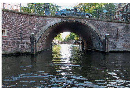
Abb. 7: Amsterdams Grachten (einziger Standort mit Blick durch eine und zu sieben Brücken).

Dann folgte Amsterdam, die unvergleichlich pulsierende Hauptstadt, in der alle Macht den Radfahrern gehört. Eine sehr kompetente Führerin machte uns mit der frühen Geschichte und Sehenswürdigkeiten der Altstadt bekannt. Eine geruhsame, kommentierte Grachtenfahrt führte uns durch das Kanalsystem und rundete das Bild ab (Abb. 7). Ein perfektes Steak in einem der unzähligen Restaurants jeglicher Provenienz, sorgte dafür, dass der Tag auch kulinarisch erfolgreich abgeschlossen werden konnte.