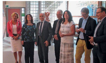
Abb. 8: Unsere Gesprächspartner in Wageningen.

Ein weiterer Höhepunkt folgte am zweitletzten Tag im Campus der Universität Wageningen. Unsere holländischen Kollegen weihten uns in ihr Konzept betreffend die Ausbildung vom Vor- bis zum Hochschulalter und die permanente Weiterbildung ein. Holland leidet, wie praktisch alle europäischen Länder, unter Nachwuchsmangel. Zunächst wurden vor