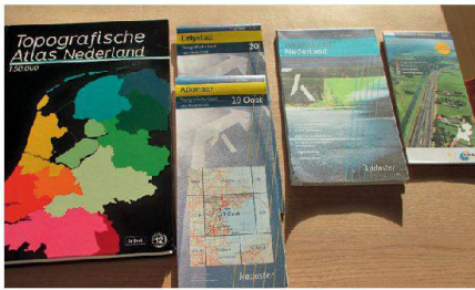
Abb. 2: Topografischer Atlas als Buch und Kartenblätter von Holland.

nach wie vor kartenorientierten Ansatzes ist, dass neue Resultate permanent an eine «alte» Situation angepasst werden müssen und sich das Kataster- und Kartenwerk dabei laufend verschlechtert. Mit dem schweizerischen Ansatz wird das Alte durch Neues ersetzt und damit das Kataster- und auch das Kartenwerk ständig der neuen Situation in der Wirklichkeit angepasst. Unsere holländischen Kollegen sind sich der Probleme bewusst. Sie rechnen damit, dass sie innerhalb der nächsten 20 Jahre einen konsistenten neuen Kataster haben werden.