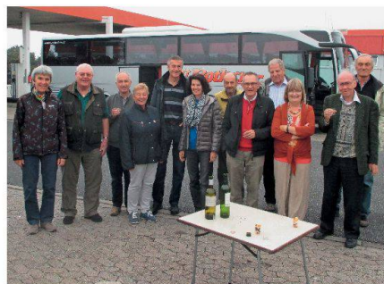
Abb. 1: Die Reisegesellschaft.

Der erste Ausflug führte nach Zwolle, wo sich eine Zweigstelle des Kadasters befindet, der jedoch sein Hauptquartier im benachbarten Apeldoorn hat. GIN und Kadaster wurden uns