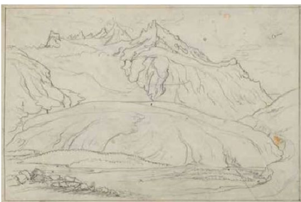
Abb. 5: Skizze zu Rhonegletscher von der Talsohle bei Gletsch gesehen.

werte ästhetische Sicherheit, mit welcher der Künstler bei dem Alpen-Projekt Neuland betritt?