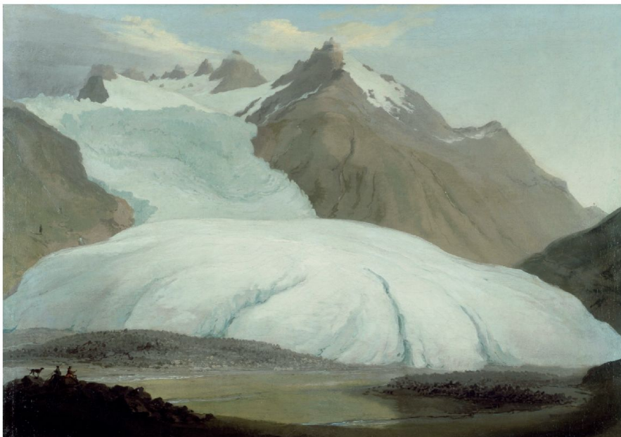
Abb. 4: Rhonegletscher, von der Talsohle bei Gletsch aus gesehen.