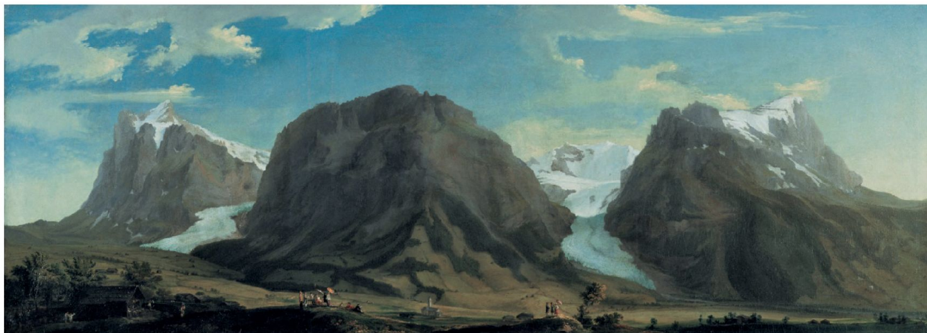
Abb. 1: Panorama des Grindelwaldtals mit Wetterhorn, Mettenberg und Eiger.

Wolfs Bilder lassen sich weder der in seiner Zeit populären Vedutenmalerei zuordnen, noch handelt es sich um Darstellungen mit explizit dokumentarischem Anspruch. Sie berühren vielmehr Prinzipielles: Letztlich thematisieren sie das Verhältnis der sinnlichen Wahrnehmung der Berge zu einem Begriff von Berg. Woher aber rührt die bemerkens-