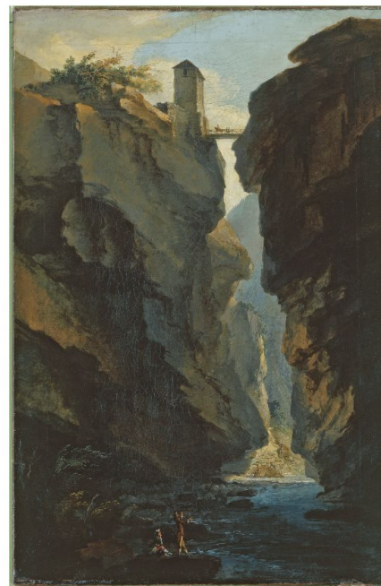
Abb. 2: Ausgang der Dala-Schlucht nach Süden.

In den Jahren von 1773 bis 1779 entstand so eine umfassende Bilderserie über die Schweizer Alpen. Im Atelier komponierte Wolf aus direkt vor Ort angefertigten Naturstudien an die 200 imposante Gemälde, die spontane Beobachtung mit höchst kunstvoller Formgebung vereinen. Wolf findet bestechende malerische Formulierungen für Bergketten und Gletscher, Wasserfälle und Höhlen, Brücken und reissende Ströme, Seen und Hochplateaus, die er mal in weiten Panoramen, mal in klaustrophobisch zugesperrten Kompositionen vorstellt. Viele prominente Naturdenkmäler sind darunter, von denen einige infolge der Umweltzerstörung der letzten Jahrhunderte nicht mehr existieren: Die