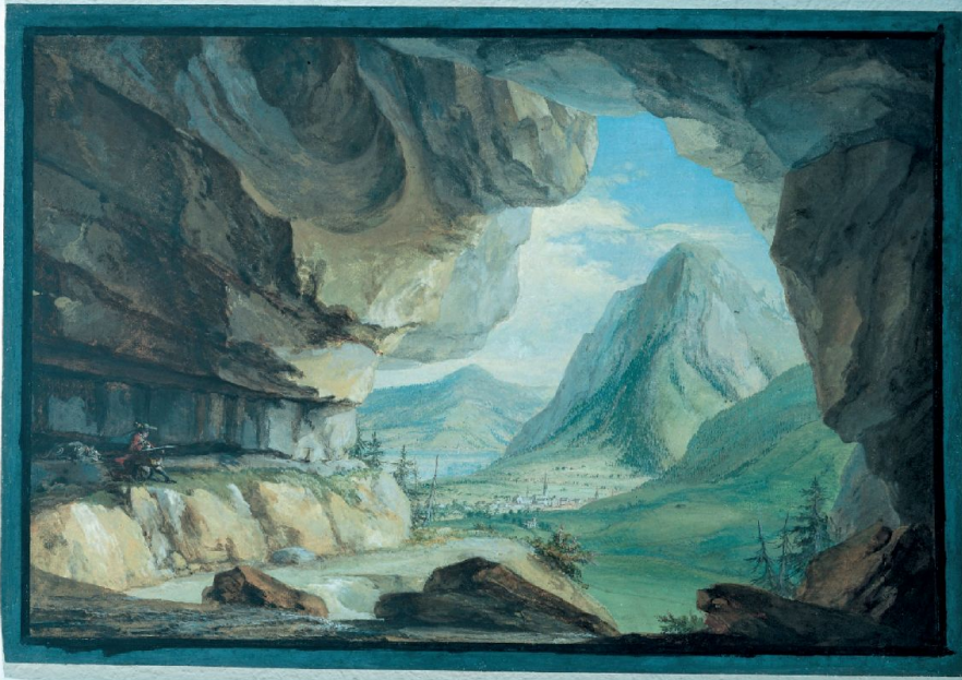
Abb. 3: Drachenhöhle bei Stans.