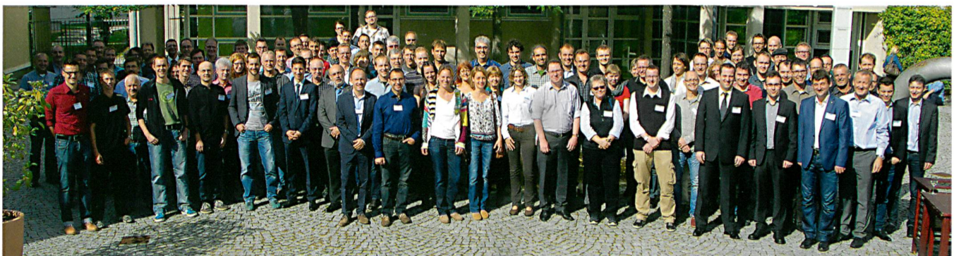
Vereint: Autodesk Geospatial Usergroup Deutschland und Schweiz. Autodesk Geospatial Usergroup Allemagne et Suisse réunis.

mée par différentes présentations qui ont ainsi constitué ledit Forum de l'AGU. Dans ce cadre, les utilisateurs ont présenté leurs