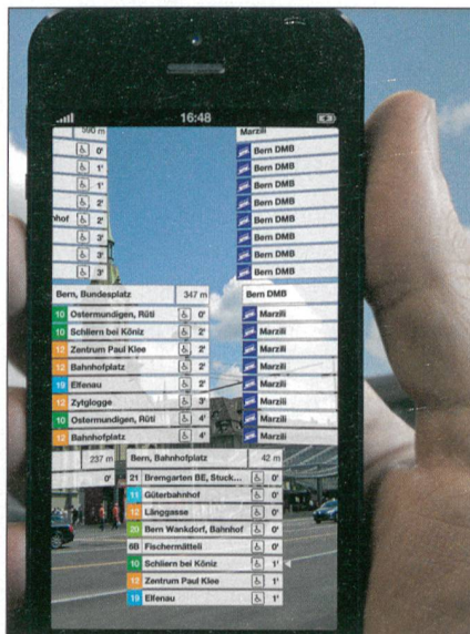
Abb.1: Die Abfahrtszeiten der öffentlichen Verkehrsmittel in Augmented Reality in der App Departures Switzerland.

Die Idee, die Daten der amtlichen Vermessung zugänglich zu machen, erstaunt. Der Kanton Solothurn hat sich dennoch dafür entschieden. Der Kanton Genf wendet das Open-Data-Prinzip uneingeschränkt auf alle in seinem Geoportal enthaltenen sichtbaren Daten an. Er hat entsprechende Bestimmungen ins Gesetz zum Genfer Geoinformationssystem (SITG) aufgenommen, damit die Sicherheit von Personen und Sachen und der Schutz der Personendaten auch bei einem freien Datenzugang gewährleistet sind ( http://ge.ch/sitg/services/services-carto/open-data ). Die Stadt Zürich hat ein Open-Data-Portal einge-