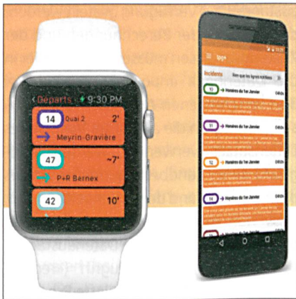
Fig. 2: Utilizzazione degli open data dei TPG via l'App tpg+.

Abb. 2: Verwendung der Daten der TPG als Open Data in der App tpg+.