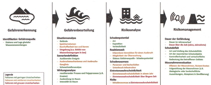
Abb. 1: Phasen in der Gefahrenbeurteilung und im Risikomanagement von Gletschergefahren mit dazugehörigen Teilschritten und Klassierung der Unsicherheit.

Häufig wiederholen sich Gefahrenprozesse an einem Gletscher. Informationen zu früheren Ereignissen sind daher sehr hilfreich. Liegen keine Informationen zu früheren Ereignissen vor oder hat sich die Situation seit den letzten Ereignissen relevant verändert, sind längerfristige Prognosen mit grossen Unsicherheiten verbunden. Dann muss auf Analysen, Annahmen und Analogieschlüsse zu ähnlichen Fällen abgestützt werden. Die Unsicherheiten sind entsprechend gross; oft bedeutend grösser als bei anderen Prozessarten. Weil Gefahrenbeurteilungen bei Gletscherhochwasser meist erst gemacht werden, wenn eine Gefahrenquelle neu entsteht, ist die Wahrscheinlichkeit gross, dass sie in kurzer Zeit anhand tatsächlicher Ereignisse überprüft werden kann – Chance für die Experten, ihre Überlegungen zu verifizieren, aber auch Fluch, weil Abweichungen Erklärungsbedarf gegenüber der Bevölkerung und Behörden nötig machen und die Glaubwürdigkeit der Experten leiden kann. Die grössten Unsicherheiten in der Gefahrenbeurteilung von Gletscherhochwasser liegen in der Festlegung der Szenarien. Die aus den Szenarien abgeleitete Wirkungsbeurteilung beinhaltet bedeutend weniger Unsicherheiten, weil es für die Ausbreitung der Prozesse heute gute Modellierungssoftware gibt. Auch die dazu notwendigen Höhenmodelle liegen in der Schweiz in hoher Genauigkeit vor.