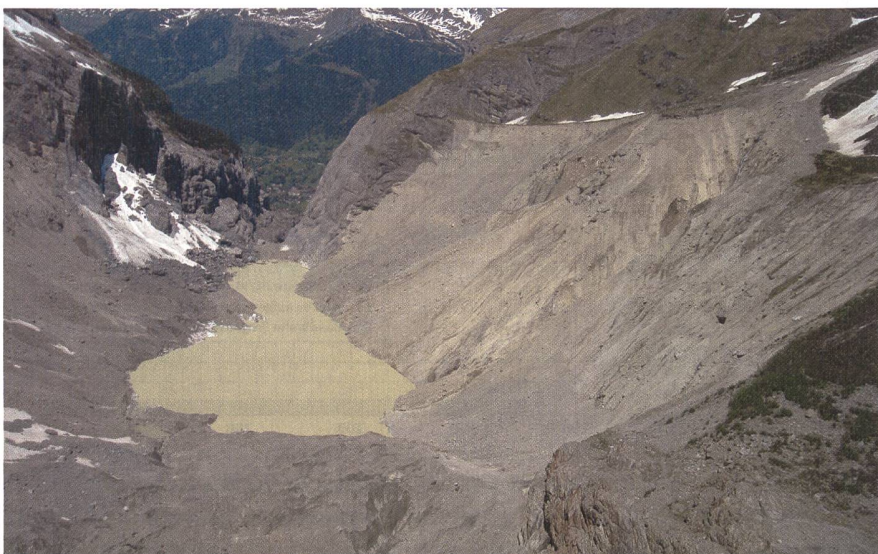
Abb. 3: Gletschersee auf dem Unteren Grindelwaldgletscher 2009.

Das Risikomanagement hat zum Ziel, Schäden an Personen und Sachwerten zu minimieren oder im besten Fall zu verhindern. Die Konzepte und Instrumente des integralen Risikomanagements bei gravitativen Naturgefahren in der Schweiz haben sich bewährt und lassen sich auch bei Gletscherhochwasser erfolgreich einsetzen. Da Gletscherhochwasser oft nur vorübergehend ein Risiko darstellen und die Wahrscheinlichkeit eines Grossereignisses meist gering ist, konzentrieren sich Präventionsmassnahmen üblicherweise auf organisatorische Massnahmen, d.h. den Schutz von Personen. Schäden an Sachwerten werden dabei eher in Kauf genommen. Das Risikomanagement setzt voraus, dass ein mögliches Gefahrenpotenzial erkannt wird. Da sich die Gletscher innerhalb kurzer Zeit stark verändern können, müssen sämtliche Schritte von der Szenarienbildung bis zur Wirkungsbeurteilung laufend überprüft und gegebenenfalls angepasst werden. Ein syste-