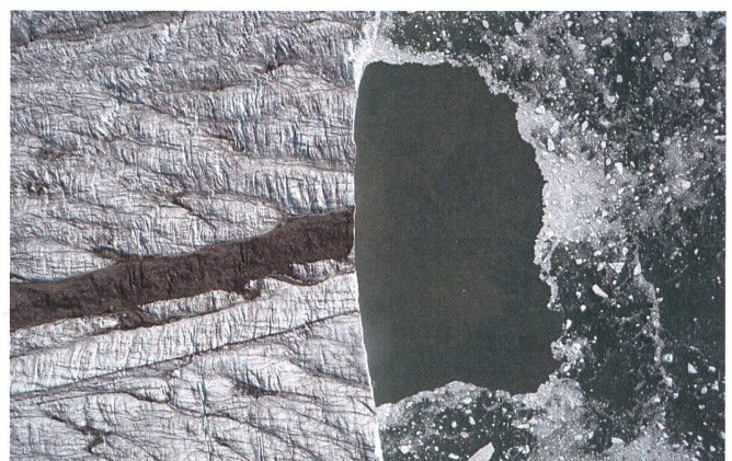
Abb. 4: Bilder der Kalbungsfront beim Bildflug vom 11. Juli 2015. Der Gletscher bricht rund 40 Meter senkrecht zum Meer ab und bildet die rund drei Kilometer lange Front. Ein grosser Süsswasserstrom aus dem Inland entwässert sich unter dem Gletscher und taucht direkt vor der Kalbungsfront auf.

Während der Expedition im Juli 2015 konnten zwei lange Flüge für die Kartierung der gesamten Kalbungsfront durchgeführt werden. Die Abbildung 4 zeigt den detaillierten Flugplan sowie die Lokalität der mit DGPS eingemessenen Passpunkte. Für die Orientierung der Luftbildblöcke wurde eine Vielzahl von Passpunkten eingemessen. Bedingt durch die Fliessgeschwindigkeit des Gletschers von rund 1.5 Meter pro Tag, mussten die Passpunkte auf dem Gletscher wiederholt eingemessen und numerisch korrigiert werden. Während der Expedition muss-