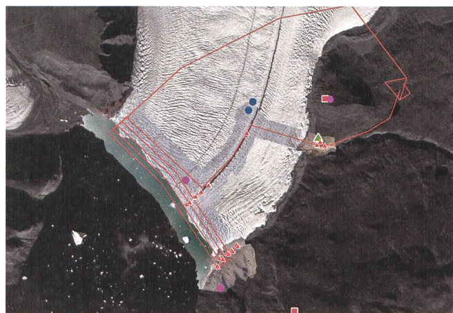
Abb. 3: Flugplan (rote Linie) der Flüge über die Kalbungsfront und die DGPS-Kontrollpunkte (rote Dreiecke). Zusätzlich die Lokalitäten der Seismik- und Infrasond-Arrays (violette Punkte), der Timelaps-Kameras (rote Vierecke) und das Camp der Expedition 2015 (grünes Dreieck).

Basierend auf den Erfahrungen von Ryan et al. (2015), fiel die Wahl auf den Nurflügler Skywalker X8. Es handelt sich dabei um ein Modell mit einer Spannweite von rund 2.1 Meter und einer grosszügig dimensionierten Ladebucht. In Zusammenarbeit mit der Firma eFlight wurden Motor und Batterien so berechnet, dass die definierten Flugeigenschaften erfüllt werden können. Für die gesamte Flugsteuerung wurde der Autopilot Pixhawk der Firma 3DR und die ArduPilotMega (APM) Plattform in Kombination mit der ebenfalls frei erhältlichen Flugplanungssoftware APM-MissionPlanner verwendet.