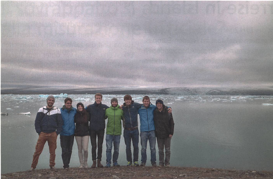
Eisschollen auf dem Weg ins Meer: Die Masterreisenden vor einer Gletscherzunge.

Haupt Herausforderungen haben auf Grund der geringen Bevölkerungsdichte und der geografischen Lage als Insel wenig mit denen der Schweiz gemein. Grundsätzlich handelt es sich aber ebenfalls um Abwägungen ökonomischer, ökologischer und sozialer Interessen, sei dies beim «Fish Farming», der Nutzung von Windenergie oder dem Planen von Hochspannungsleitungen. Besonders bemerkenswert sind die seit ein paar Jahren explodierenden Touristenzahlen, deren Anstieg durch die einmalige isländische Natur mitverursacht wird. Letztere ist aber gerade durch die exponentielle Zunahme der Besucher bedroht.