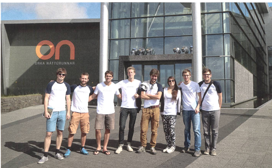
Lehrreiches über die Geothermie: Die Masterreisenden vor dem Kraftwerk Hellisheidi.

Durch den Besuch der zwei geothermischen Kraftwerke Hellisheidi und Reykjanesvirkjun erhielten wir wertvolle Informationen über die industrielle Nutzung der Geothermie. Mit Hilfe der insgesamt