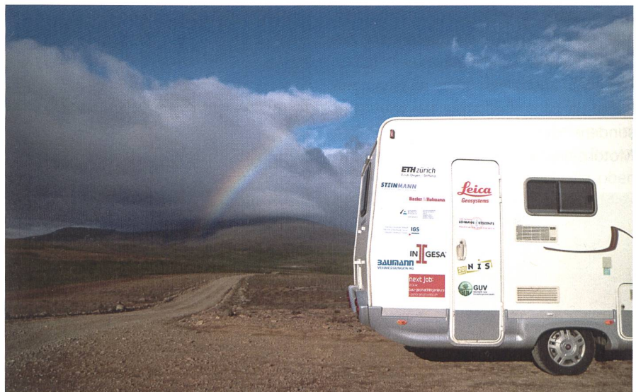
Übernachten im Naturschauspiel: Eines der beiden Wohnmobile im Nirgendwo.

Das Land verfügt über zwei formelle Planungsebenen: die nationale und die kommunale. Auf erstgenannter wurde kürzlich eine «National Planning Strategy» in einem partizipativen Prozess ausgearbeitet. Das Land wurde dabei in vier räumlich charakteristischen Gebieten, namentlich den «Central Highlands», die ländlichen, die urbanen und die marinen Gebiete, betrachtet. Die planerischen