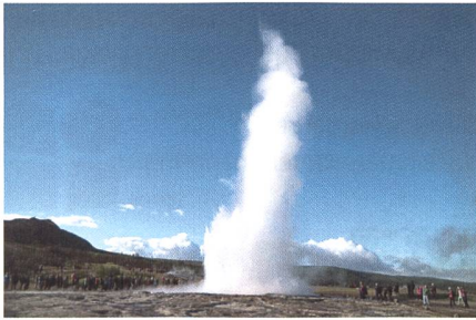
Kochendes Wasser: Der Geysir als Höhepunkt der Reise.

Norwegen absolviert. Zusätzlich wurden Budgets für die Landesvermessung zur Zeit des Staatsbankrotts stark gekürzt. Mit dem gegenwärtigen Aufschwung, wozu auch der boomende Tourismus beiträgt, schaut man aber positiv in die Zukunft hin zu einem semi-dynamischen Datum als Grundlage für Kataster, Höhenmodelle und Beschreibung der Geodynamik.