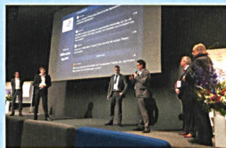
Abb. 2: CLGE Versammlung. Abb. 3: Kongress «Grenzen sprengen».