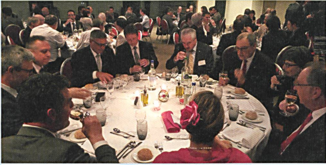
Abb. 1: Bankett «100 Jahre IGS» mit Bundesrat Guy Parmelin.