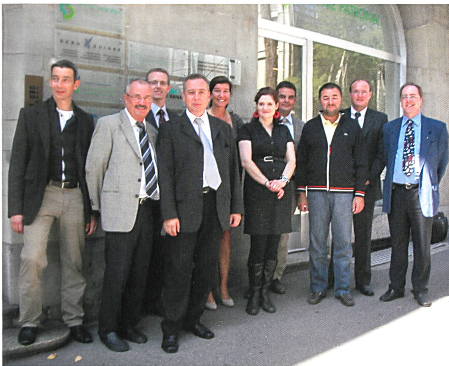
Fig. 14: Première séance du comité au CP, 2010. Abb. 14: Erste Vorstandssitzung im CP, 2010.