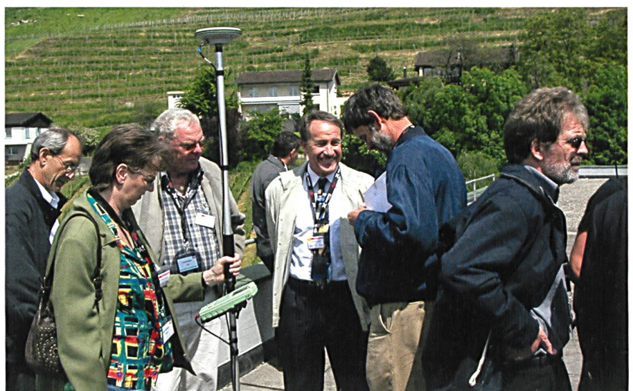
Fig. 12: Excursion chez Leica Heerbrugg, DACH 2005. Abb. 12: Exkursion bei Leica Heerbrugg, DACH 2005.

En 1948, le constat a été fait lors de l'assemblée générale que, «le géomètre n'est pas assez commerçant, un secrétaire commercial important aurait plus de succès lors de négociations tarifaires». La société fiduciaire Visura de Soleure a été engagée en 1949 pour de nouvelles enquêtes sur les frais généraux, elle a également fait des propositions pour la