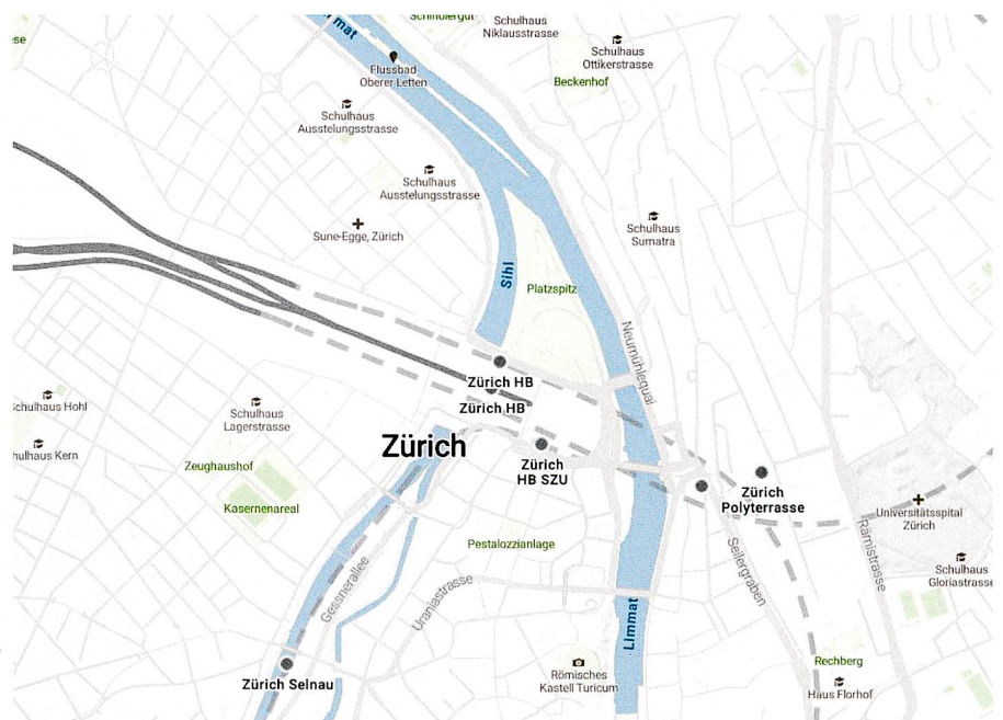
Fig. 5: Simplification et accentuation des thèmes pour améliorer la lisibilité et l'orientation au moyen de données vectorielles (par ex. réseau ferroviaire). Abb. 5: Vereinfachen und Hervorheben von Themen zur Verbesserung der Lesbarkeit und Orientierung mittels Vektordaten (z.B. Bahnnetz).

Les possibilités de paramétrage des visualisations dynamiques dans les systèmes de production sont aujourd'hui plus ou moins amples et les fonctionnalités sont constamment améliorées. Le travail dans ces systèmes exige toujours du savoir