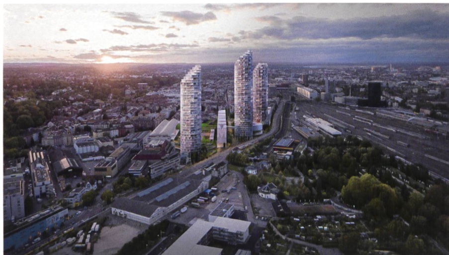
Abb. 2: Dreispitz Basel (Herzog & de Meuron).