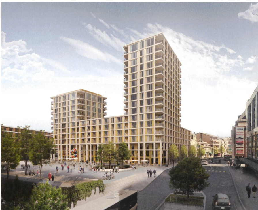
Abb. 5: Ilot Sud in Morges (Fehlmann Architectes).

schenbach AG nach Plänen von Staufner & Hasler Architekten und Ballmoos Krucker Architekten realisiert.