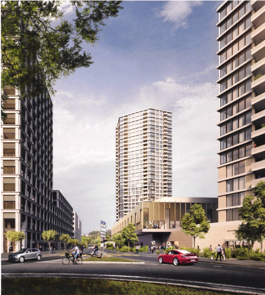
Abb. 3: Sport- und Eventhalle Pilatus Arena in LuzernSüd (Giuliani Hönger Architekten).

zügigen Freiräumen ein beispielhafter Beitrag zur qualitativollen Verdichtung sei. Nebst einem Stadtpark wird auch das Nutzungspotenzial von Dachflächen mit einbezogen.