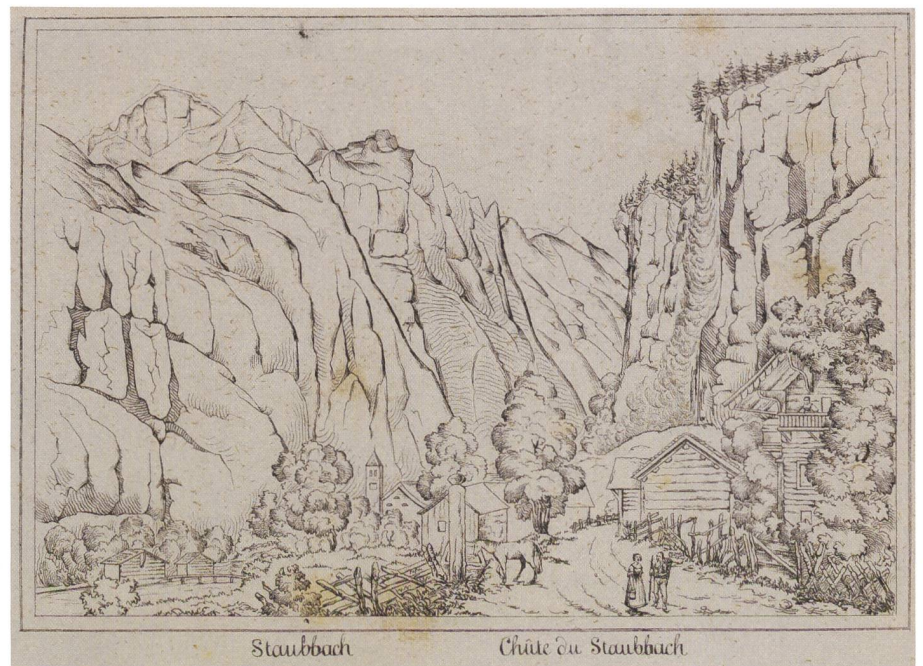
Fig. 2: Chute du Staubbach, in Karl Baedeker, La Suisse. Manuel du voyageur... , Koblenz, K. Baedeker éd., 1852.

gardées avant le voyage ou après celui-ci. Avant le voyage, elles ajoutent au rôle de séduction déjà évoqué, une fonction d'information mais aussi de codage culturel: le Baedeker de la Suisse de 1852 invite graphiquement à venir voir 16 lieux: les chutes du Rhin, Weggis, le Rigi Kulm, la chapelle de Tell sur le lac des Quatre-Cantons, Interlaken, la cascade du Staubbach (fig. 2), la Wengernalp, les glaciers de Grindelwald et de Chamonix (qui faisait alors partie des hauts-lieux du voyage en Suisse), l'hospice du Grimsel, le glacier du Rhône, le pont du Diable de la route du Gothard, le nouveau pont suspendu de Fribourg, le château de Chillon, les bains de Pfäfers et la Viamala. Si ces illustrations avaient certainement un rôle d'appel au voyage, elles étaient aussi profondément normatives: voilà ce que l'on verra, mais aussi ce que l'on doit voir, car ce sont les passages obligés de la mode touristique du temps. Le voyageur séduit n'avait plus qu'à se mettre en route pour aller faire l'expérience in situ de ce que l'image lui avait permis de connaître. Quand on feuillette aujourd'hui un guide touristique montrant le Golden Gate, la grande barrière de corail ou les statues de l'île de Pâques, les principes de séduction et de