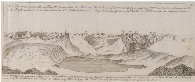
Fig. 3: Vue panoramique autour du lac de Zoug, in Instructions pour un voyageur qui se propose de parcourir la Suisse... , Johann Gottfried Ebel, Bâle, Tourneisen, 1795 (© Laurent Dubois, BCU-L).

reconnaissance à la base du tourisme culturel ne fonctionnent pas autrement. Une fois de retour chez soi, si l'on se prend à regarder les images du guide de voyage, c'est pour se souvenir ou pour comparer, si cette fonction est clairement atténuée à notre époque où l'on photographie à tout va, elle devait être beaucoup plus forte au XIX e siècle, et permettre aux voyageurs de retrouver, grâce aux gravures des guides, les émotions ressenties sur le moment, quand ils se trouvaient face aux Alpes ou dans le lacet vertigineux d'une route de montagne.