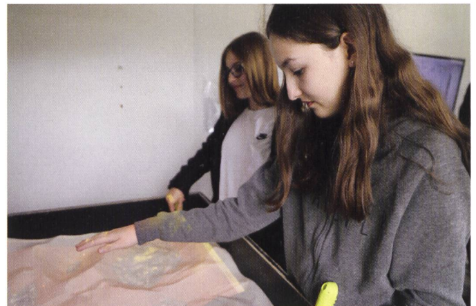
Abb. 5: Mit dem «AR Sandkasten» entdeckten die Teilnehmenden in spielerischer Form Grundlagen der Topographie.