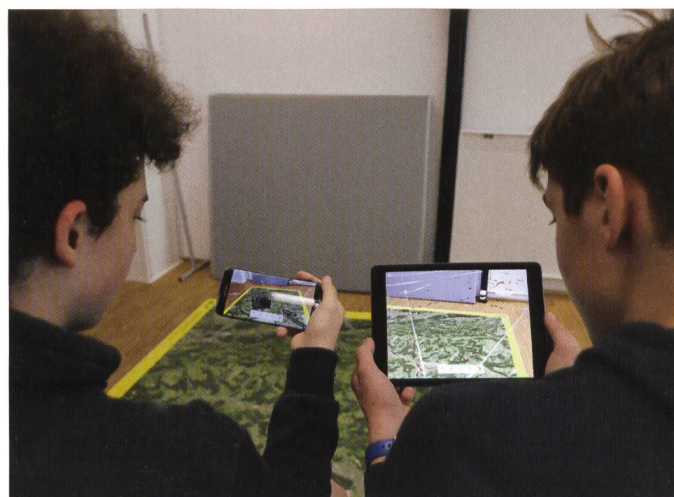
Abb. 2: Die Schulklassen beschäftigen sich mit der am Institut Geomatik entwickelten Augmented Reality App.