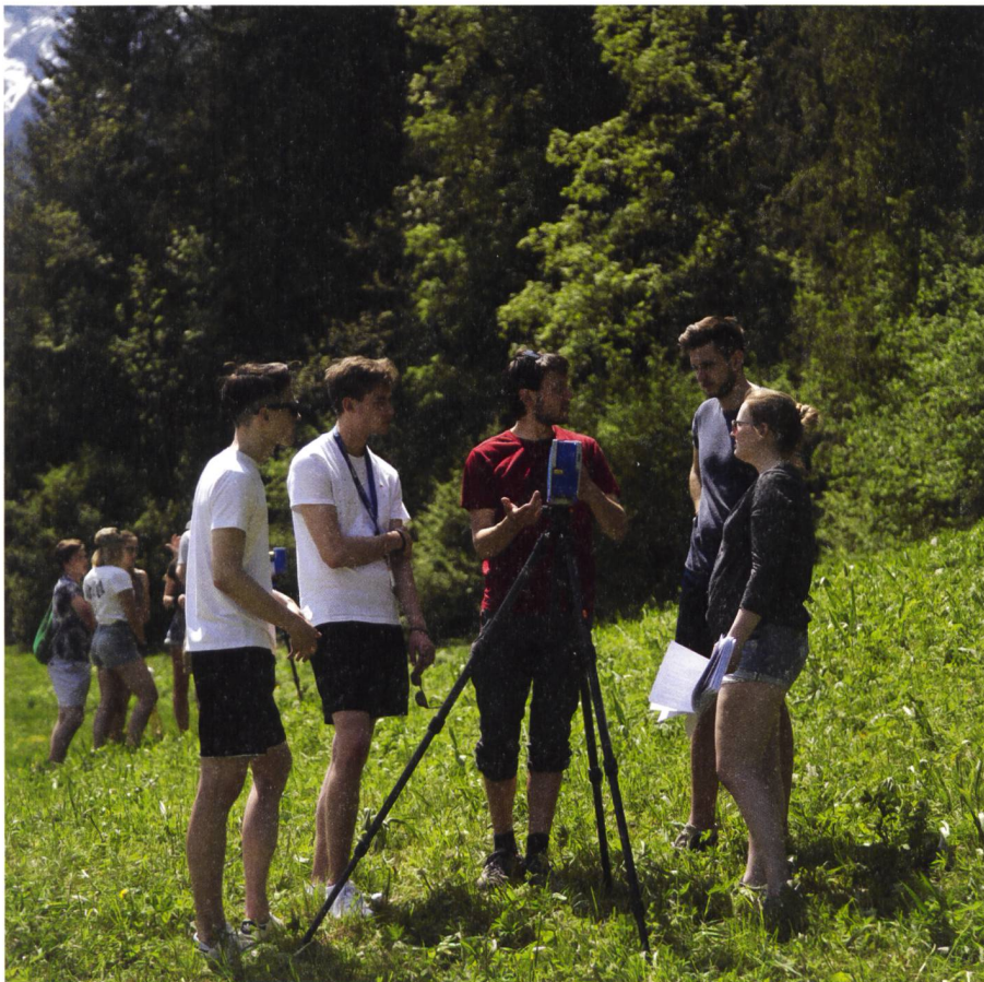
Abb. 2: Studierende am Feldkurs «Geodätische Messtechnik GZ».

Im zweiten und dritten Studienjahr stehen Fächer im Vordergrund, bei denen es zentral um die Erfassung, Analyse, Visualisierung und Nutzung räumlicher Daten