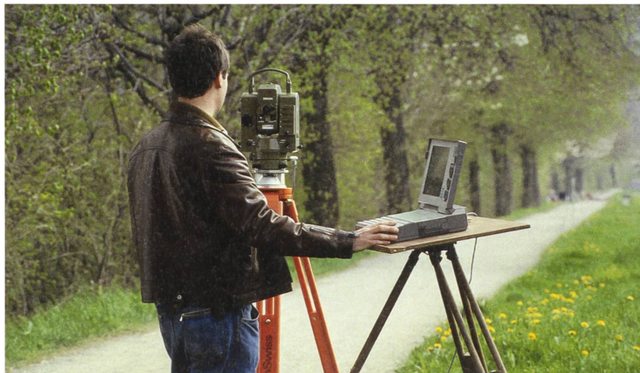
Abb. 3: Totalstation mit Theodolit E 2 und Distanzmesser DM 504 mit verbundenem Laptop zur Datenverarbeitung, Ende der 1980er-Jahre. (Stadtmuseum Aarau, Sammlung Kern).

auch der Name Kern abgeschafft. Die Aarauer Konzerngesellschaft heisst nun Leica Aarau AG. 8 Am 29. Januar 1991 kommt Markus Rauh, der Vorsitzende der Konzernleitung, nach Aarau. Er hat schlechte Nachrichten im Gepäck. Leica Aarau AG wird geschlossen, die Produk-