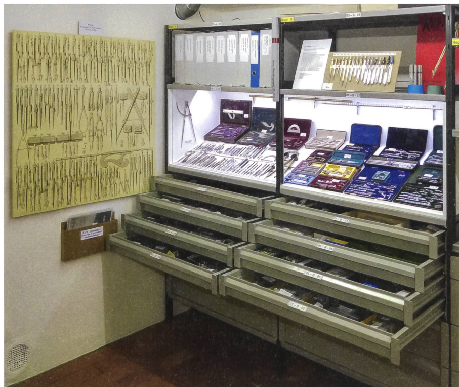
Abb. 4: Ein Blick in die Studiensammlung Kern: Einzelinstrumente und Sets aus der Reisszeug-Produktion.

Die Studiensammlung wird von der «Arbeitsgruppe Kern» aus ehemaligen Mitarbeitenden von Kern, Mitarbeitenden des Stadtmuseums und weiteren Fachleuten erschlossen und unterhalten. Sie konnte in den letzten 30 Jahren durch Schenkungen und Leihgaben erweitert werden. Die Sammlung ist bedeutend, umfasst sie doch nicht nur eine repräsen-