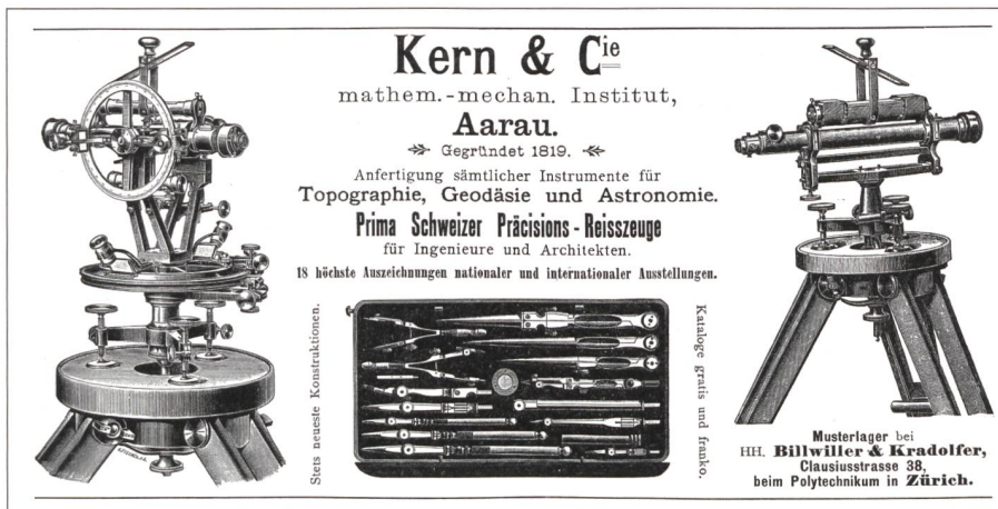
Abb. 1: Eines der ältesten Inserate aus der Schweizerischen Bauzeitung von 1899.