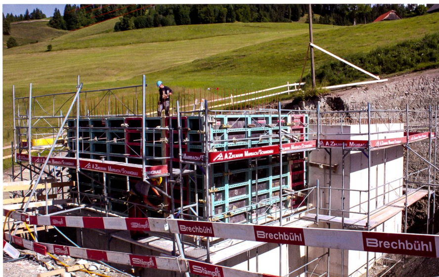
Abb. 1: Neubau Reservoir Längschwand.

Mittel 180 Liter Wasser liefern. Die ausgewählten Quellen liegen auf einer Höhe von 945 m und 1010 m. Ein Grossteil des künftigen Versorgungsgebietes liegt demzufolge höher als die Wasserbezugsorte. Das Wasser der Quelle von Michlischwand muss (bei Maximalverbrauch) in das höher gelegene Reservoir Längschwand (exkl. Löschwasserreserve) und von dort in das Reservoir Chnubelsegg (inkl. Löschwasserreserve) gepumpt werden. Das Wasser ab