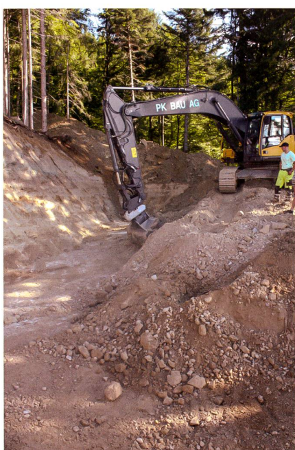
Abb. 2: Vorbereitungsarbeiten für Standort Reservoir Chnubelsegg.

Das Fassungsvermögen der Reservoirs beträgt für Längschwand 130 m 3 (Tagesverbrauch Niederzone, Puffer für Nachtförderung Hochzone) und für Chnubelsegg 150 m 3 (Tagesverbrauch Hochzone, Löschreserve gesamt). Bei beiden Reservoirs ist zudem ein Puffervolumen für einen Störfall enthalten (50% Tagesverbrauch). Das Reservoir Längschwand dient zudem als Pumpstation und Druckbrecheranlage. Bei den Pumpstationen wurden je zwei Pumpen installiert, die alternierend fördern und dadurch die Betriebssicherheit wesentlich erhöhen. So können Schäden beheben oder Revisionen an den Pumpen durchgeführt werden, ohne dass die Wasserversorgung unterbrochen werden muss. Die Gesamtlänge der Pumpendruckleitungen misst 3000 m, die der Hauptleitungen 9000 m. Alle Hauptleitungen wurden als geschweisste HD-PE-Rohre verlegt, alle Pumpendruckleitungen und Verteilungen mit PE-Druckschläuchen erstellt. Das neue Verteilungsnetz führt durch teilweise sehr steiles Wies- und Weideland, vereinzelt auch durch Wald. Auf der ganzen Leitungslänge war der Untergrund felsdurchsetzt. An diversen Stellen waren