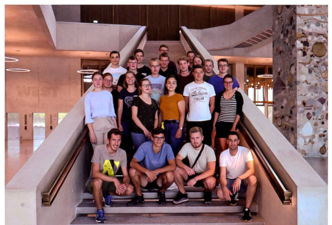
Abb. 4: Teilnehmende der Geomatik Summer School 2019 im neuen Campus Muttenz.