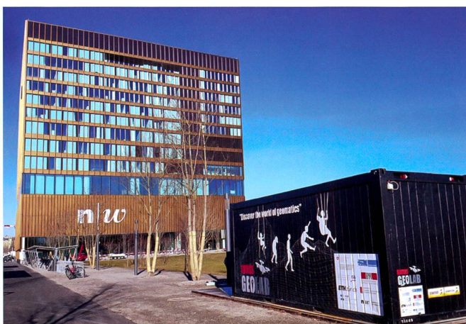
Abb. 3: Das SwissGeoLab stand vom Februar bis Mai 2019 im Park des FHNW Campus Muttenz.

120 Kinder stürmten am 14. November, dem Nationalen Zukunftstag , die FHNW in Muttenz. Im Nationalen Programm «Seitenwechsel» wurden von den Hochschulen am Standort Muttenz sieben verschiedene Workshops für Mädchen (Technik, Informatik, Bauen) und erstmals auch zwei Workshops für Jungs