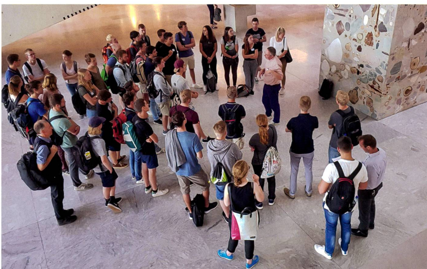
Abb. 1: Die neuen Bachelorstudierenden beim Rundgang im Campus Muttenz.

Der Lehrgang «Geomatiktechnik» ist eine modulare Ausbildung zum eidgenössischen Fachausweis in Geomatiktechnik und wird vom Bildungszentrum Geomatik Schweiz ( BIZ-Geo )