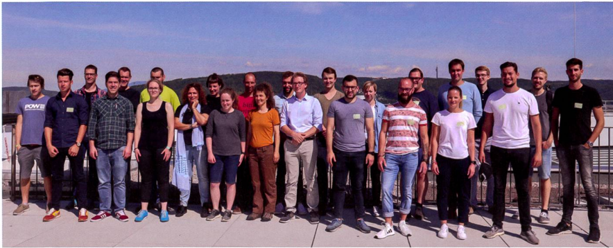
Abb. 2: MSE-Masterstudierende beim Start des Herbstsemesters 2019.

angeboten. Das Modul «Erfassungstechnik» des Lehrgangs «Geomatiktechnik» wird seit langem erfolgreich von der FHNW unterrichtet und in Muttenz durchgeführt.