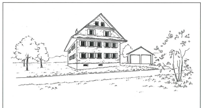
Abb. 4 und 5: Gestalterische Details wie die Planung der Garagen und Balkone machen oft einen grossen Unterschied. So wirkt dieses Wohnhaus mit einem separaten Carport weniger wuchtig und passt besser in die Umgebung (Laura Scherzmann, Ganz Landschaftsarchitekten BSLA).