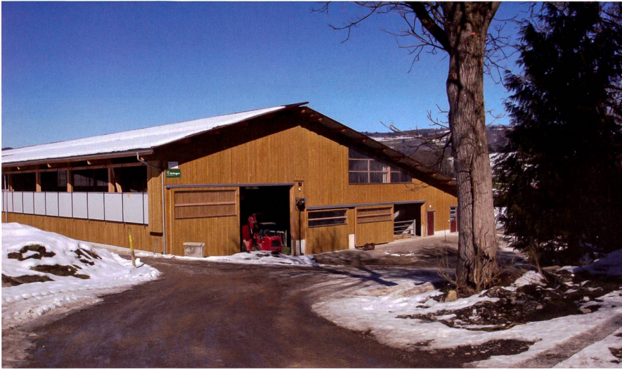
Abb. 1: Auch grossvolumige Ökonomiegebäude lassen sich gut ins Gelände einbetten. Grosse Öffnungen bringen Licht und Luft in die Gebäude (Krieger AG).

gefangen sein. Und die anderen Kinder möchten vielleicht auch noch etwas erben. Was die Zukunft und der Markt bringen werden, weiss niemand. Betriebsumstellungen könnten notwendig werden. Dafür sind finanzielle Reserven vorzusehen. Oder die Bauernfamilie bleibt in ihrer misslichen wirtschaftlichen Lage stecken. Einem Betriebsleiterpaar stehen rund 30 Jahre aktive Zeit zur Verfügung. Vom ersten Tag an muss darum das verfügbare Geld auf das übergeordnete Zielsystem aufgeteilt werden. Alles in ein Bauprojekt zu stecken, geht nicht mehr.