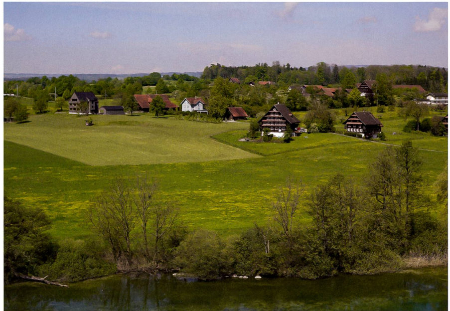
Abb. 3: Der Ersatzbau eines alten Bauernhauses links im Bild fällt erst nach genauerem Hinsehen auf.

Landwirtschaftliche Wohnbauten sind nicht einfach aus der Bauzone importierte Einfamilienhäuser. Die Betriebsleiterwohnung ist eine Mischung privater Wohnräume und «öffentlicher» Geschäftsräume (Büro, Besprechungsraum, Umkleide). Die räumliche Anordnung dieser Funktionen entscheidet über eine langfristig konfliktfreie Nutzung. Die Grundrisse von Betriebsleiterwohnung und Altenteil müssen so konzipiert sein, dass sich verschiedene, im gleichen Ge-