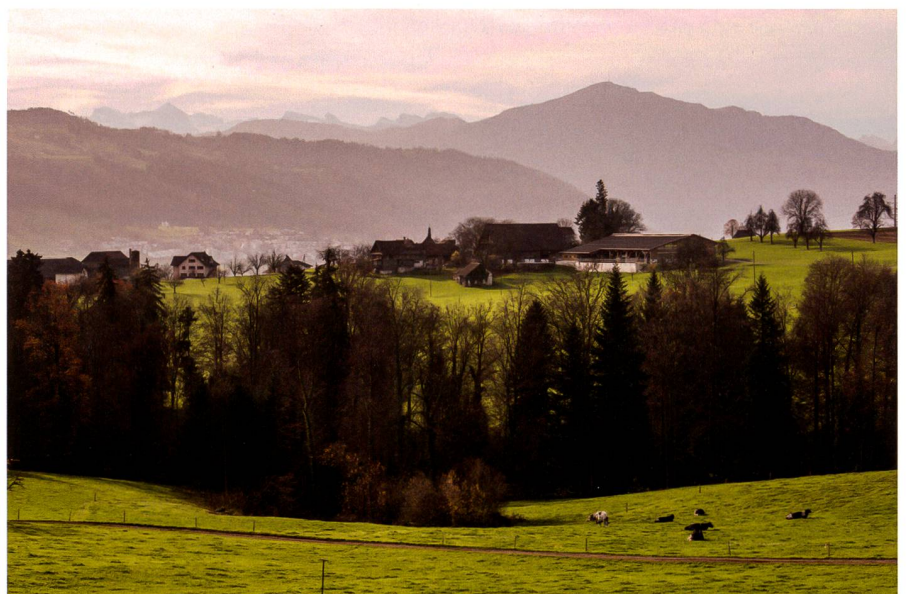
Abb. 2: Die Fassade wirkt durch die einheitliche Torgestaltung harmonisch und ruhig. Die Tore sind so konzipiert, dass alle Flächen maschinell beschickt werden können (Markus Bühler-Rasom).

Die Aspekte des Gewässerschutzes sind zu erfüllen: Auch Abstandsvorschriften gegenüber Wald, Gewässer und Schutz-zonen sowie der bauliche Tierschutz sind einzuhalten. Aus einer Aufstockung des Tierbestandes können sich Einschränkungen in der Nährstoffbilanz ergeben. Einzelne Kantone kennen auch Vorgaben zur Reduktion von Ammoniakemissionen. Zunehmend an Bedeutung gewinnen die Geruchs- und Lärmabstände. Sie sind gegenüber der Bauzone und gegenüber nicht-landwirtschaftlichen Wohnnutzungen in der Landwirtschaftszone einzuhalten. Sind sie nicht eingehalten, muss im Falle einer Klage die landwirtschaftliche