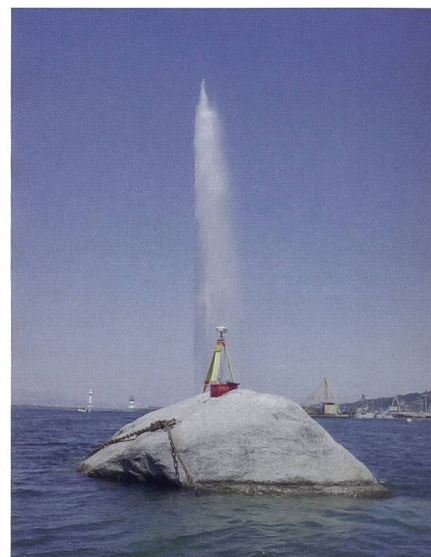
Fig. 1: La première mesure GNSS sur le RPN fut probablement effectuée en 1996, lors de la campagne d'été des futurs ingénieurs géomètres de l'ETH Zurich.

four (1787–1875), alors ingénieur du canton et de la ville de Genève , qui ordonna sa mise en place en 1820. Établir ici un lien direct avec la Carte Dufour, œuvre cartographique reine en Suisse, constituerait cependant une erreur. En effet, l'attention se portait alors sur la délicate «question du niveau», au cœur de ce qu'il est convenu d'appeler «la grande dispute lémanique» [Bissegger 2014]. Le canton de Vaud accusait les Genevois d'entraver l'écoulement naturel du Rhône par des pieux, des digues et des installations industrielles, provoquant ainsi les inondations dont les riverains du lac étaient les victimes. Dufour voulait surveiller le niveau du Léman à proximité de son extrémité, sur une base scientifique. Le RPN servait d'indicateur de niveau, complété par sept chevilles visibles depuis la rive et espacées verticalement entre elles. Autrement dit, l'objet de notre célébration doit sa création à une raison très terre à terre, une querelle entre Vau-