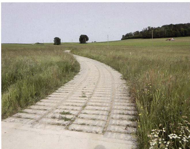
Fig. 2: Détail de la construction du chemin en plots de béton.

Au vu de la quantité d'eau retenue puis déviée par l'ancien chemin, l'aménage-