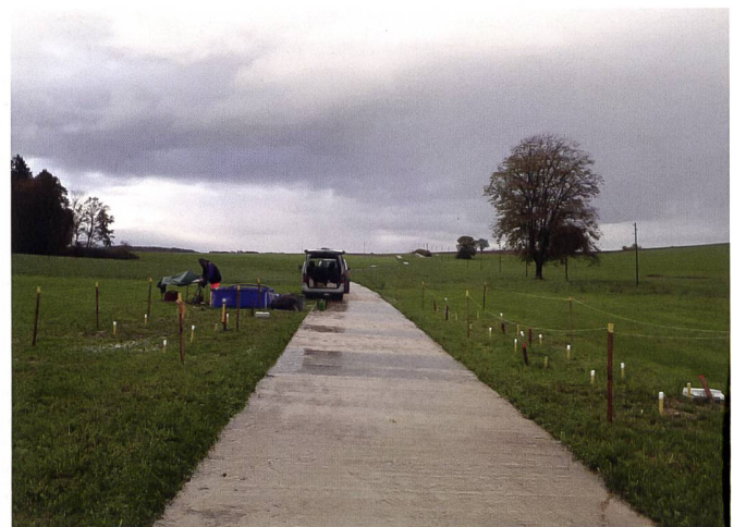
Fig. 3: Chemin en dalles de béton. Les écoulements de surface franchissant le chemin au niveau des barrages sont bien visibles.