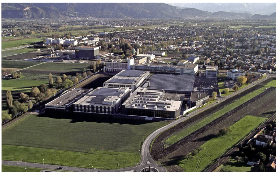
Abb. 8: Das SFS-Firmengelände Rosenbergsau in Heerbrugg, 2006.

vom Wild/Leica-Firmengelände aus. Es handelt sich um die ehemalige Optikkfertigung (heute Swiss Optic AG), die Elektronikfertigung (Escatec Switzerland), die Mechanikfabrik (2019 als Geschäftseinheit Polymeca in die Leica Geosystems zurückgekehrt), die militärisch ausgerichteten Spezialkonstruktionen (Safran Vectronix AG) und die Sparte Werkstoff- und Verfahrenstechnologie, die als APM Technica heute auch die Instrumentengläser der Harley Davidson-Motorräder beschichtet. Die weiteren Clusterunternehmen sind deutlich älter als die fünf genannten.