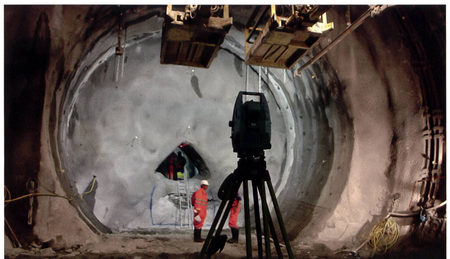
Abb. 6: Bei Bau und Überwachung des Gotthard-Basistunnels der NEAT, mit 57 km längster Eisenbahntunnel der Welt, kommen verschiedene Leica Geosystems-Instrumente zum Einsatz, z.B. Totalstationen, GPS-Systeme und Digitalnivelliere. Die Abweichung auf die gesamte Distanz betrug nur wenige Zentimeter.

erstarkte das Unternehmen vor allem im und nach dem Zweiten Weltkrieg und war in den Siebzigerjahren mit 4300 Beschäftigten in Photogrammetrie und Vermessung Weltmarktführer. Darauf folgten