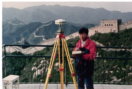
Abb. 5: Wild-GPS-System 200 bei einer Demonstration vor der Grossen Mauer in China.

erstarkte das Unternehmen vor allem im und nach dem Zweiten Weltkrieg und war in den Siebzigerjahren mit 4300 Beschäftigten in Photogrammetrie und Vermessung Weltmarktführer. Darauf folgten