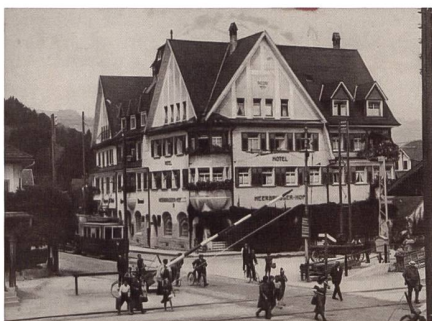
Abb. 3: Blühender Verkehrsknotenpunkt: Eisenbahnlinie und Strassen tram am Bahnhof Heerbrugg, 1911.