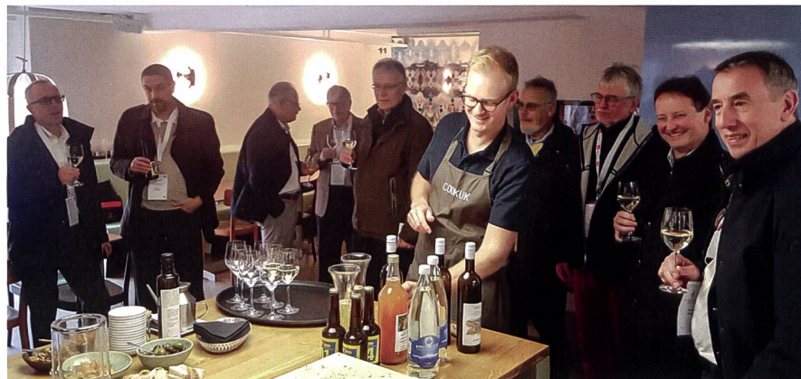
GGGS-Tagung «200 Jahre Kern Aarau» 2019.