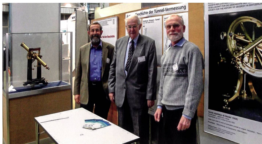
GGGS-Infostand am Anlass zum Hauptdurchschlag im Gotthardbasistunnel an der ETH Zürich 2010.