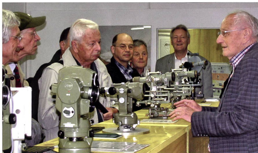
GGGS Mitgliederversammlung in Aarau 2012.