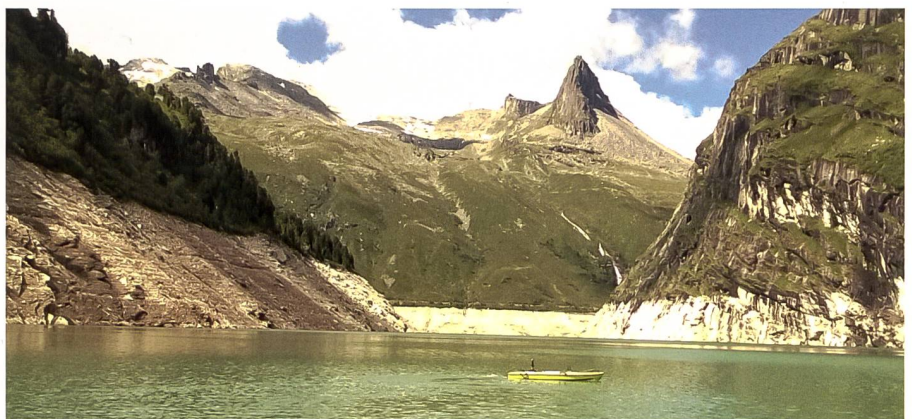
Abb. 1: Echolot-Aufnahmen mit Modellboot, Stausee Zervreila. Fig. 1: Prise de vue par bateau prototype, lac de barrage de Zervreila.

Dass ich bereits vor der Geburt des ersten Kindes schon voll «angekommen» war im Betrieb, machte es natürlich einfacher, nachher mit reduziertem Pensum weiterzuarbeiten, ohne dabei auf spannende Aufträge verzichten zu müssen. In meinen Augen braucht es dafür von Seite Arbeitnehmer und Arbeitgeber viel gegenseitiges Vertrauen, Koordination und auf beiden Seiten eine gewisse Flexibilität. Nach der Geburt des zweiten Kindes durfte ich mich Projekten für die Einführung eines Echolot-Modellbootes für die Hydrografie sowie für den Aufbau von Photogrammetrie-Lösungen widmen. Neue, herausfordernde Projekte, die mir zum Teil viel abverlangten und für welche eine hohe Frustrationstoleranz von Vorteil war: Der erste Drohnenabsturz sowie das Ausloten der Grenzen des Machbaren mit den neuen Technologien brauchten immer wieder ziemlich viel Nerven.