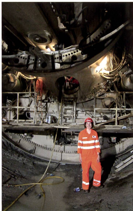
Abb. 1: Durchschlagsvermessung Erstfeld, Juni 2009.

Nach 4.5 intensiven aber auch tollen Jahren an der ETH startete ich 2008 meinen beruflichen Werdegang bei der AlpTransit Gotthard AG in Luzern. Bei der Bauherrin des längsten Eisenbahntunnels der Welt mitzuarbeiten war ein unglaubliches Glück. In unserem kleinen Vermessungs-Team war ich zuständig für die Planung und Begleitung der Vermessungsarbeiten der Bauherrschaft. Die Koordination der Vermessungsarbeiten