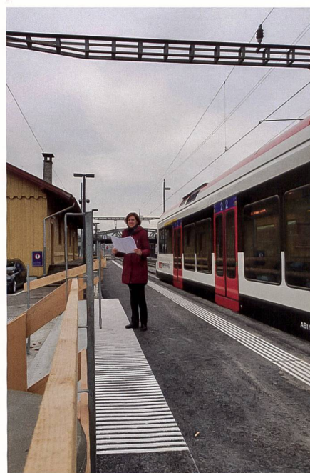
Fig. 3: Inspection pour la planification de la transformation de la gare de Brunnen, novembre 2021.

Rétrospectivement, j'ai pu acquérir des expériences variées. Hormis quelques si-