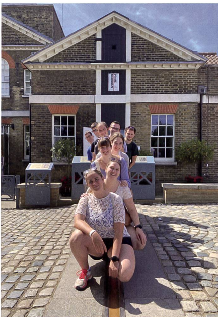
Abb. 1: Gruppenfoto auf dem alten Nullmeridian.

Die Reise begann mit einer Zugfahrt über Paris nach London, wo wir die ersten vier Tage der Reise verbrachten. Eine Hop-on Hop-off Bustour führte uns von der Tower Bridge zum Big Ben, zur Westminster Abbey und Buckingham Palace, am Hyde Park vorbei zum London Eye. Weiter haben wir die National Gallery, das National Maritime Museum, die HMS Belfast und die Wachablösung beim Buckingham Palace angeschaut. Bei einem Besuch einer