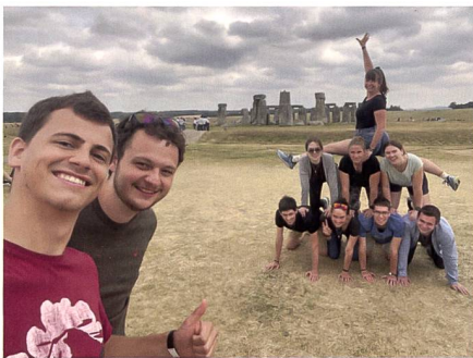
Abb. 5: Gruppenfoto bei Stonehenge mal anders.

uns, dass sie während mehreren Jahren am astronomischen Institut der Universität Bern gearbeitet hat, wobei sie unter anderem an