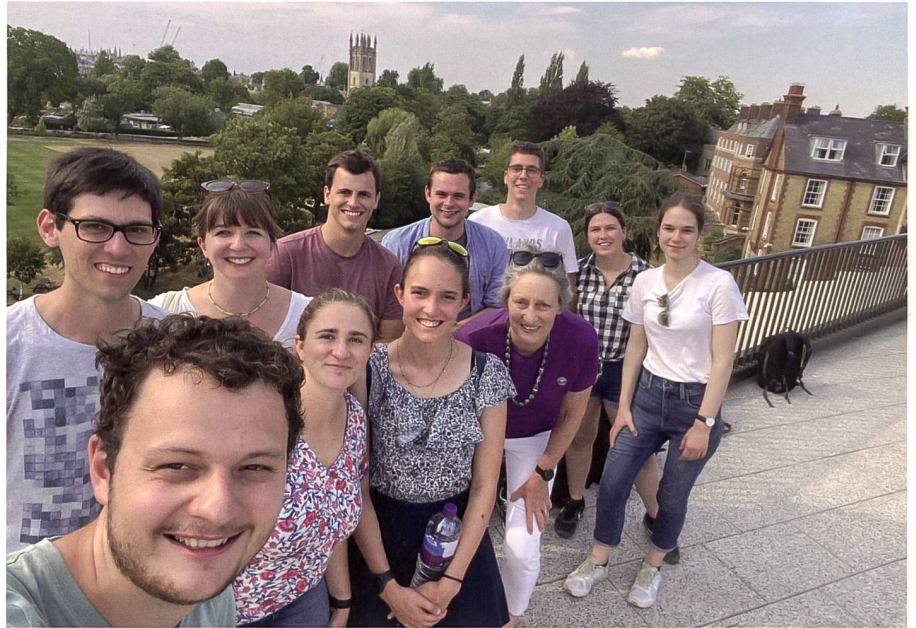
Abb. 2: Auf dem Dach des St. Hilda's College in Oxford.

lokalen Whiskeydestilliererei und dem Musical Phantom of the Opera liessen wir uns kulinarisch und kulturell verwöhnen.