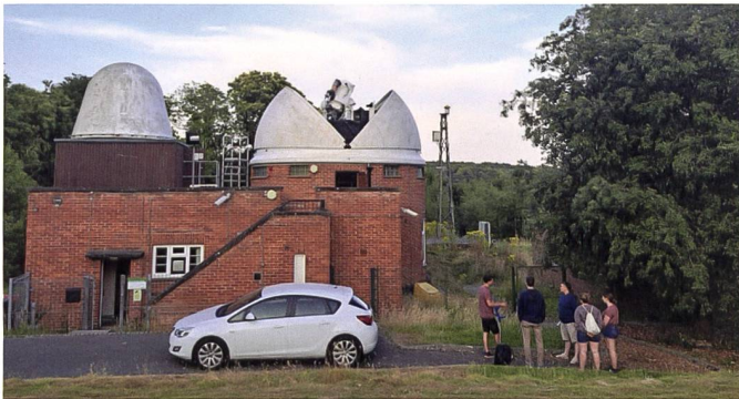
Abb. 3: Führung durch die NERC Space Geodesy Facility (SGF) in East Sussex.