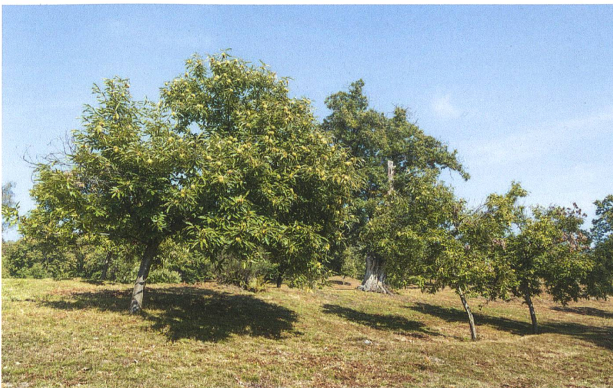
Abb. 3: Cademario TI.

La remise du Prix Schulthess des jardins a eu lieu le samedi 22 octobre 2022 à Cademario (TI).