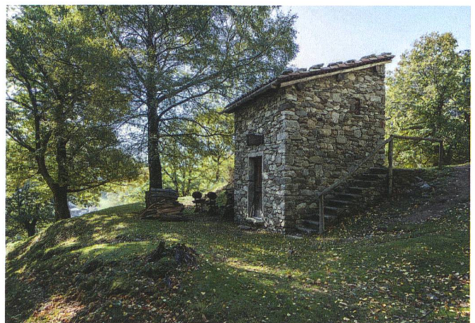
Abb. 2: Vezio TI.