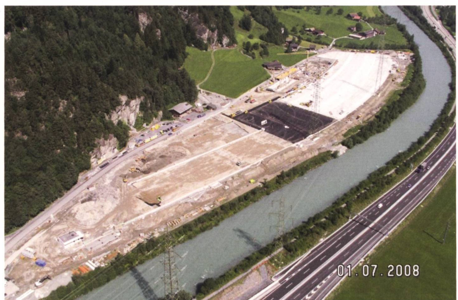
Abb. 3: Exkurs Kulturland.

Im Wissen, dass in jedem Projektgebiet andere Voraussetzungen, unterschiedliche Interessen und verschiedene Akteure aufeinandertreffen, wurde die «Landwirtschaftliche Planung» LP entwickelt. Obwohl es sich dabei um eine lösungsorientierte, allgemein anwendbare Grundlage handelt und die Interessenabwägung als Grundsatz in der RPV (Art. 3) verankert ist, übten sich die Raumplaner stets in Distanz zu diesem Arbeitsinstrument. Zu Unrecht, denn es gab auf der praktischen