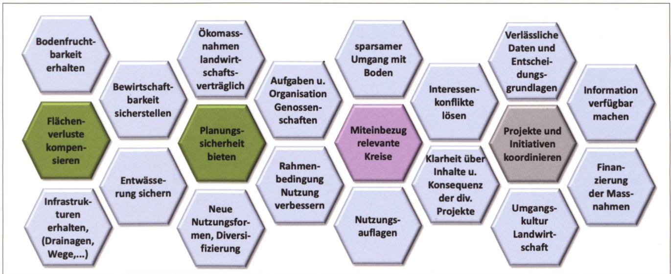
Abb. 2: Relevante Herausforderungen.