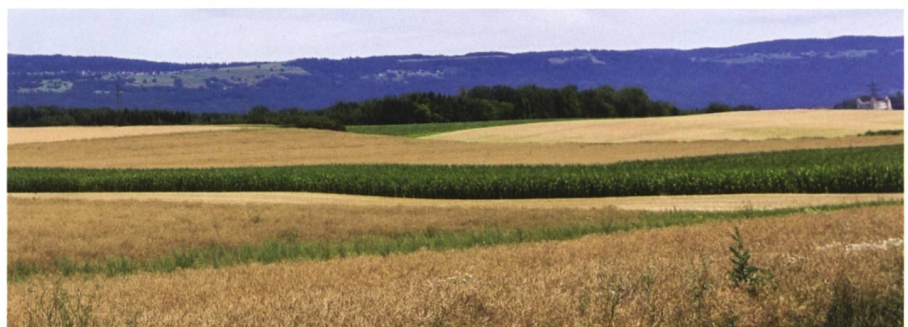
Abb. 1a und b: Beispielfeld aus der Orbe Ebene mit a) stehendem Wasser im Januar und b) Raps Kultur im Juli. Der hohe Wasserstand signalisiert schlechte Drainage, welche zu einer sehr heterogenen Entwicklung der Anbaukulturen im Sommer führt.