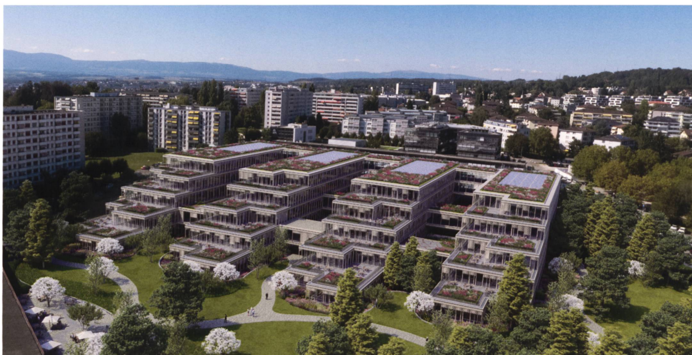
Unlimitrust Campus à Prilly.

Prochain module organisé (sous réserve de modification): «S4 Base de données» novembre 2023.