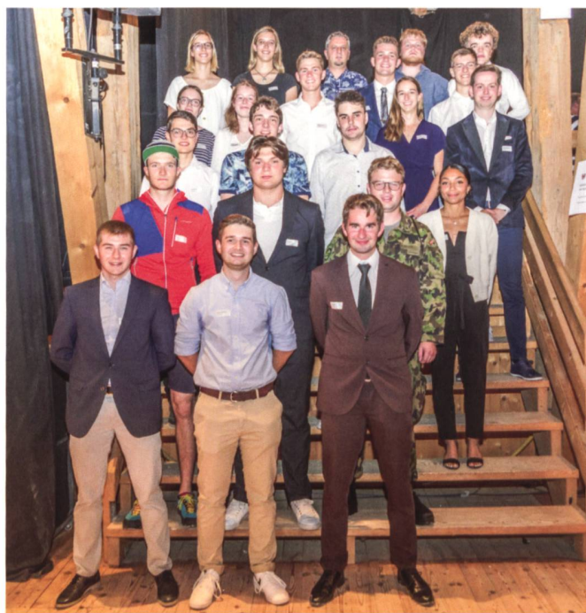
QV-Feier Kanton Bern.