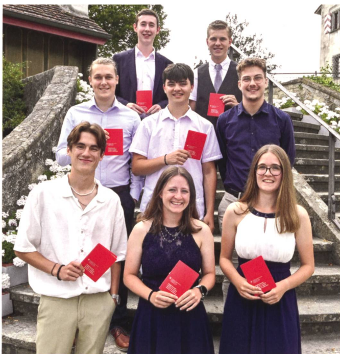
QV-Feier Kanton Aargau.