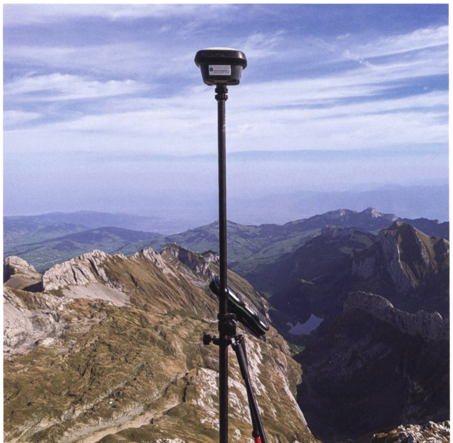
Hersche Ingenieure setzen für die Nachführung der amtlichen Vermessung im Kanton Appenzell Innerrhoden auf rmDATA-Software.

rmDATA AG Täferstrasse 26 CH-5405 Dättwil Telefon 041 511 21 31 office@rmdatagroup.com www.rmdatagroup.com