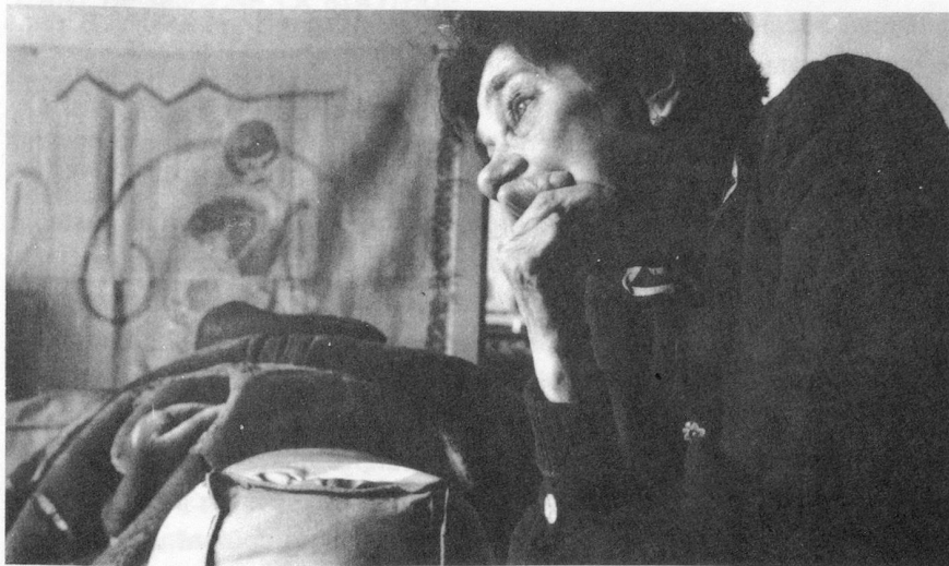
Le rêve de jadis : le théâtre.

Il est hasardeux de se livrer à des comparaisons, tant le monde a tendance à « aller » vite, toujours plus vite ! Néanmoins :