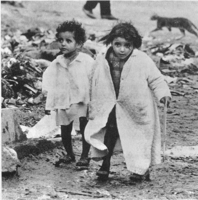
Les enfants de la misère sont aussi ceux de l'espoir.