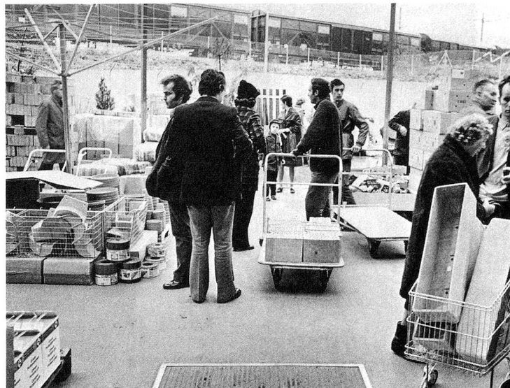
Tout pour le jardin...

pratiqué par les commerces vendant l'objet terminé. Et ce qui est vrai pour une table de salon l'est aussi pour tous les autres meubles qui s'achètent en pièces détachées au « Do it ».