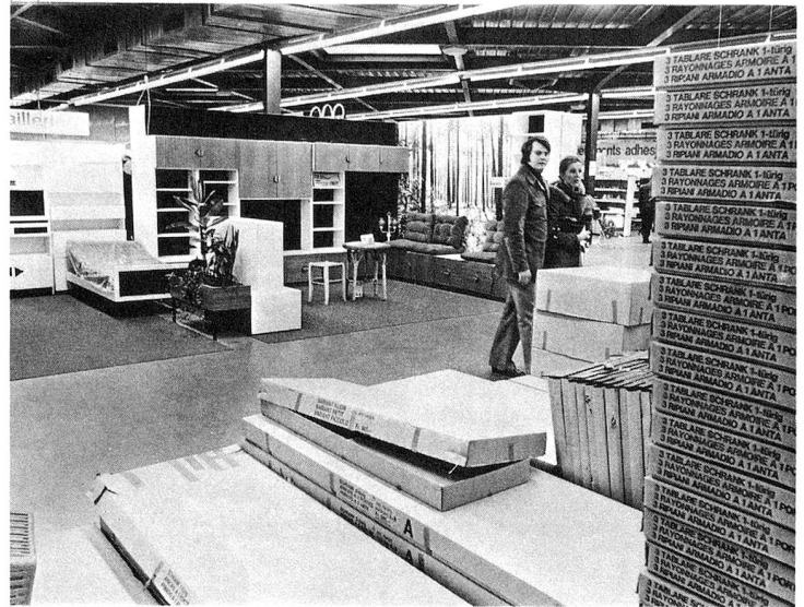
Les meubles en pièces détachées. Au fond : le meuble terminé.

Il est possible aux fiancés de fabriquer leurs meubles, de tapisser leurs chambres, de poser tapis et moquettes, d'installer salle de bain et cuisine, de décorer leurs locaux à leur goût. Il est possible aux retraités, même de condition modeste, de donner un nouveau visage au vieil appartement; de permettre à la dernière phase de