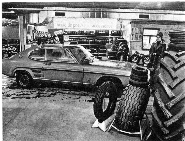
Au sous-sol, on vend et monte les pneus.