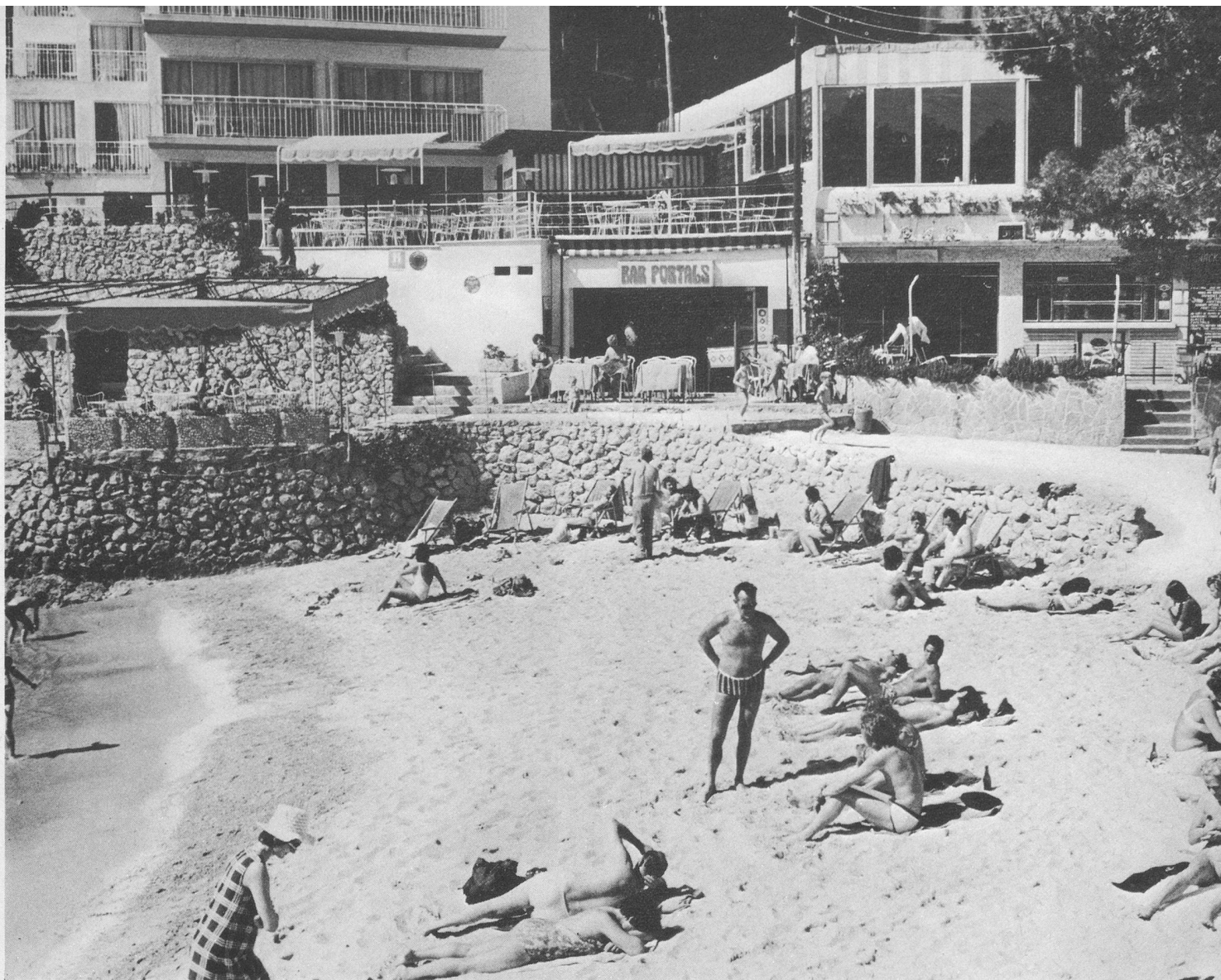
La plage est située à deux cents mètres de l'hôtel. On y trouve aussi d'accueillantes guinguettes où la sangria est fraîche.