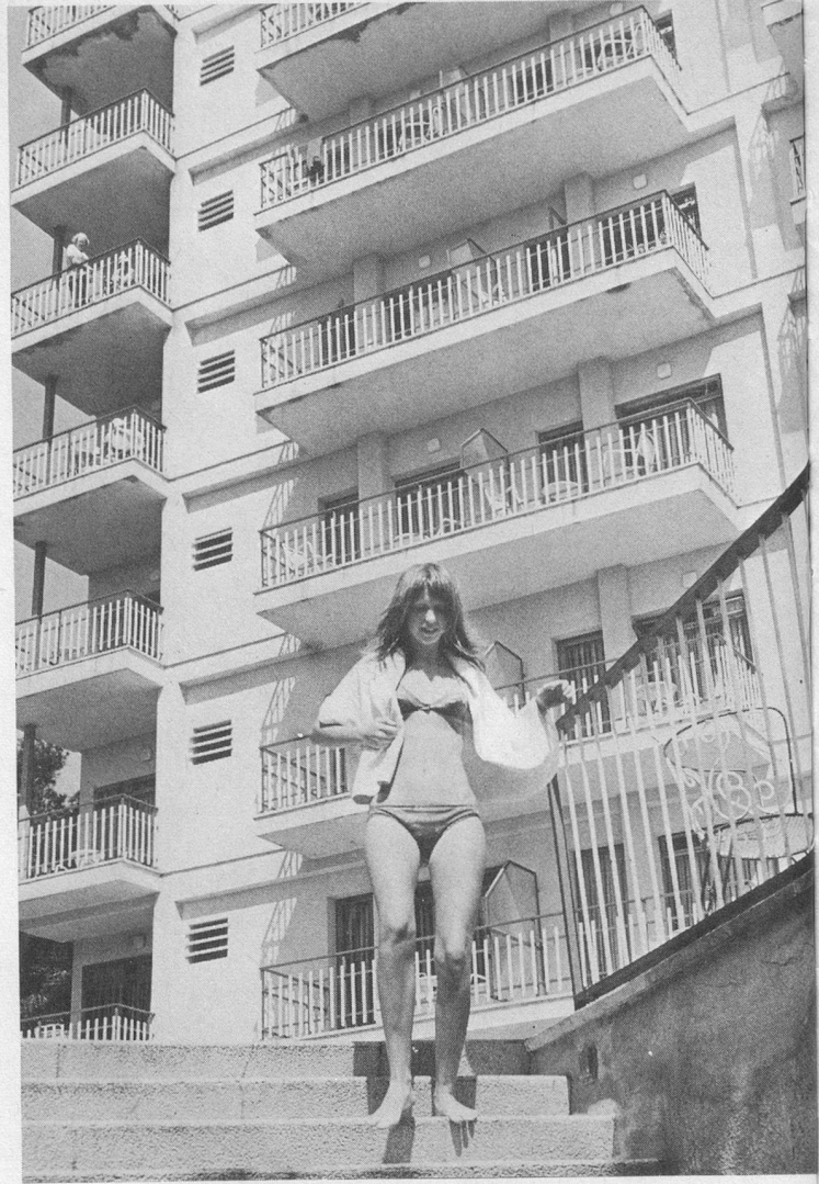
Un hôtel moderne où la jeunesse n'est pas absente.