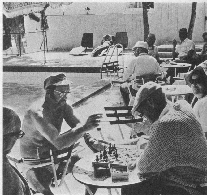
Des retraités heureux autour de la piscine.