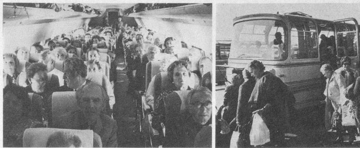
Les moyens de transport les plus modernes à la disposition des retraités: jet et car.