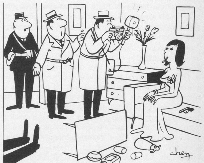
C'est ce corps-là qu'il faut photographier! (Dessin de Chen - Cosmopress)