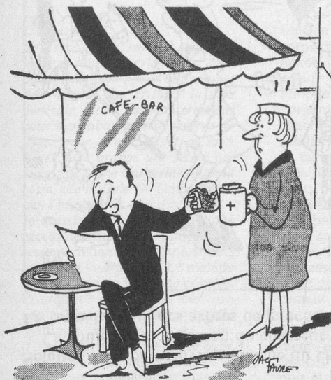
— A la vôtre... (Dessin de Faure - Cosmopress)