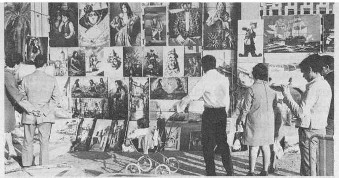
Tout près du port de Palma, une exposition en plein air parmi d'autres.

C'est à dessein que nous avons choisi les trois villes mentionnées plus haut: le soleil leur témoigne une fidélité bienfaisante; les jours de pluie sont exceptionnels. A Palma de Majorque, deux hôtels modernes et confortables reçoivent nos voyageurs: l'Hôtel Bahamas, à Portals Nous, et l'Hôtel Torrente à El Arenal. Tous