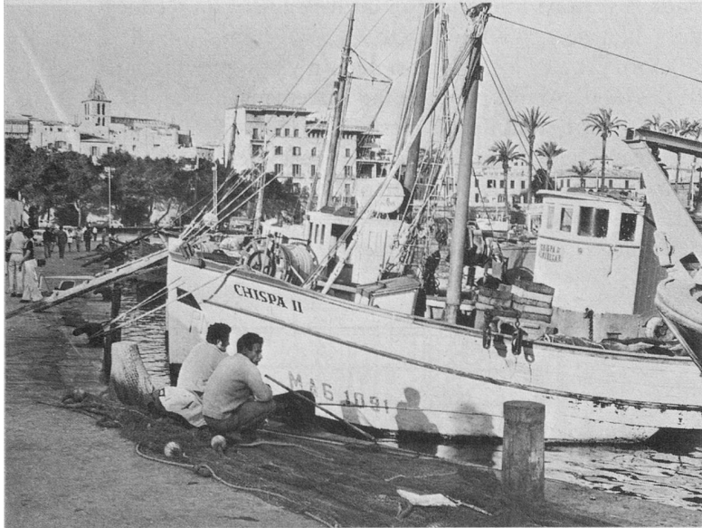
Flâner sur les quais de Palma, sous le ciel bleu, parmi les pêcheurs.

Nos voyages de vacances à Palma de Majorque (Espagne), Dubrovnik (Yougoslavie) et Beyrouth (Liban) sont pour nos abonnés et amis une occasion rêvée de raccourcir l'hiver, cette saison froide que tant de personnes redoutent, surtout à un certain âge. Les jeunes attendent l'hiver avec impatience, pour pouvoir se livrer aux joies du ski. Mais pour beaucoup de plus de 60 ans, la saison blanche constitue une véritable épreuve. Il y a le froid, l'humidité, les chemins glissants et la grippe qui menace.