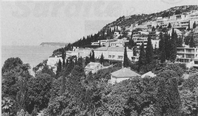
Vue du balcon d'une chambre de l'Hôtel Park, à Dubrovnik.

Je m'inscris / Nous nous inscrivons pour le voyage-vacances à