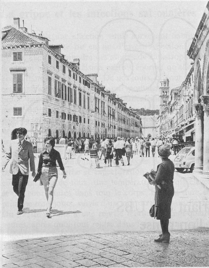
La vieille ville de Dubrovnik est une merveille. On n'y circule qu'à pied.

DUBROVNIK (Yougoslavie): Départs les 2 février 1973, 16 février, 2 mars, 16 mars . Quinze jours de vacances, tout compris, avion-jet et hôtel très grand confort (2 piscines) pour Fr. 485.— (abonné); Fr. 495.— avec abonnement d'un an; Fr. 525.— pour personne non abonnée (chambre 1 lit, supplément Fr. 70.—).