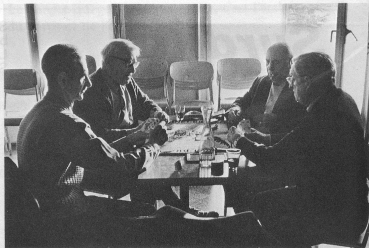
Même sans flash, de bonnes photos d'intérieur sont possibles.

Sur les appareils plus compliqués, le réglage du diaphragme se fait selon des chiffres, par exemple: 2,8 - 4 - 5,6 - 8 - 11 - 16... La plus grande ouverture est 2,8 dans ce cas; à utiliser par faible lumière. A l'opposé, 16 est le réglage le plus fermé du diaphragme, à utiliser en plein soleil.