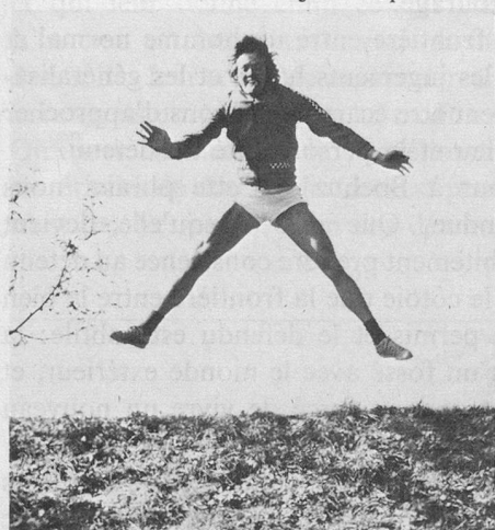
Cette photo a été prise au 1/500 e de seconde.

La dernière fois, nous vous avons montré une photo bougée. Ceci posait le problème de la vitesse. Vous savez que, pour prendre une photo, un mécanisme, appelé obturateur, obéissant à votre index, laisse pénétrer la lumière derrière l'objectif pendant une fraction de