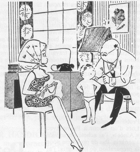
Quand je serai grand, je veux devenir toubib... Il y a des jours où vous ne devez pas vous embêter! (Dessin de Caille - Cosmopress)

Voici comment procéder au lavage des foulards de soie. Savonnez-les d'abord à froid. Rincez-les méticuleusement et égouttez-les. Faites ensuite bouillir une poignée de son dans de l'eau. Filtrez la décoction à travers un linge et plongez-y les foulards que vous laisserez quelque temps dans le bain. Pressez-les, étendez-les et repassez-les pendant qu'ils sont encore humides.