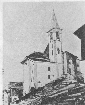
La vieille église disparue. Rares sont ceux qui la regrettent.

fait de la surnommer le « blockhaus », ce qui est bête et méchant. Qu'elle puisse choquer, irriter les conservateurs inébranlables, soit! Mais un coup d'œil rapide ne saurait suffire. Il faut la découvrir, l'admirer sous tous ses angles. Il faut jouer le jeu magique du béton qui se fait créneau, dentelle, fusée, masse énorme, masse légère. Béton et bois. Puissance et sou-