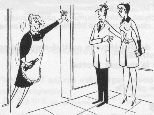
— Si je comprends bien, nous allons de nouveau avoir des babas au rhum pour dessert... (Dessin de Raynaud - Cosmopress)