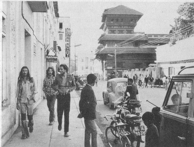
L'ancien palais royal (à droite) marque la limite de la ville moderne. Au-delà, c'est la tradition et le rêve.