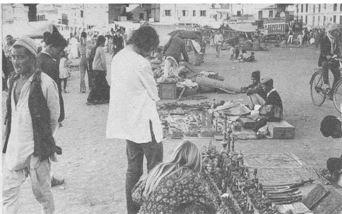
La place du marché de Kathmandou, théâtre d'un commerce très actif, rendez-vous des hippies venus du monde entier.

moyens, et quelques autres, crasseux, où le voyageur hésite à s'installer s'il tient à un minimum de confort et d'hygiène. N'oublions pas les « lodges », où il est possible de dormir pour vingt sous, à plusieurs par chambre, et qui sont notamment le rendez-vous des hippies. Certains de ces établissements sont propres et accueillants. Ce ne sont pas la majorité.