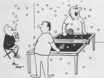
Fernande! Appelle le gosse avant que je pique une crise de nerfs! (Dessin de Faure-Cosmopress)

est vital pour elle de ne prêter le flanc à aucune critique, à aucune suspicion. La loterie doit être, et elle est, du super-sérieux, du cousu-main. Ce qui n'exclut nullement la bonne humeur.