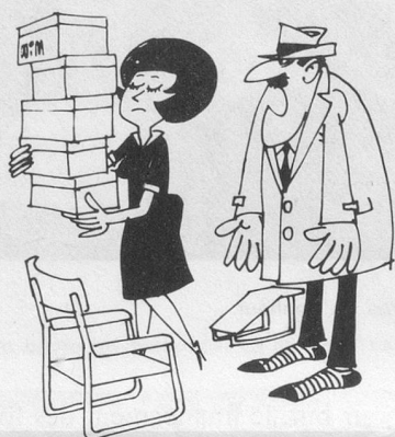
Mais je suis tout à fait sûr d'être arrivé chez vous avec des souliers! (Dessin de Mœse-Cosmopress)