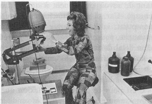
La vedette Catarina Valente, mordue de la photo, a installé sa chambre noire dans sa salle de bain.

Il faut d'abord obscurcir la fenêtre, ce qui peut se faire avec du papier ou du tissu noir épais que vous fixez simplement avec des punaises. Vous pouvez ensuite, avec un panneau de bois, ou de pavatex un peu épais, créer un plan de travail sur la baignoire. Le couvercle des WC fournit une autre surface utilisable pour le matériel de développement et d'agrandissement que vous allez utiliser.