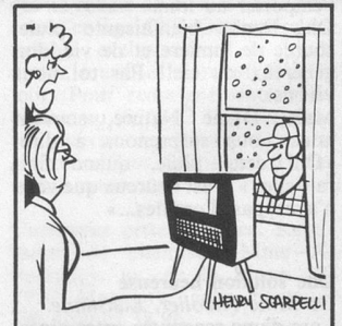
Le docteur lui a ordonné de respirer beaucoup d'air frais. (Dessin de Scarpelli-Cosmopress)